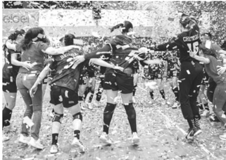
Feljutást ünnepelt Marosvásárhely női kézilabdacsapata

Miután visszajutott az A1 osztályba, a CSU Medicina női röplabdacsapata ismét megpróbált ütőképes keretet kialakítani. Edzőként az orosz-olasz kettős állampolgár Dmitrij Pancsenkót szerezte meg,