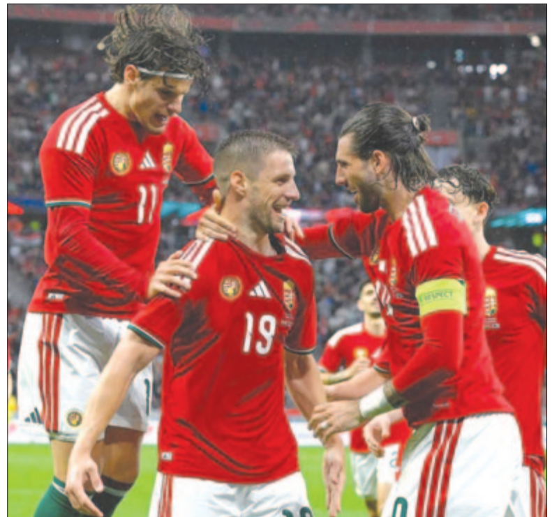
A gólszerző Varga Barnabás (k), valamint Kerkez Milos (b) és Szoboszlai Dominik a Magyarország – Finnország barátságos labdarúgó-mérkőzésen a Puskás Arénában 2026. június 5-én

Az őszi Nemzetek Ligájára készülő magyarok kedden Debrecenben a kazahokat fogadják.