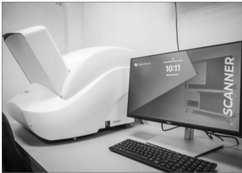
Fotók: Bereczky Sándor

A beruházást Paula Cerghizan projektmenedzser és dr. Iuliu Gabriel Cocuz munkálatvezető ismertette. Mint mondták, a kettes számú Poliklinikán található laboratórium teljes körű rákdiagnosztikai vizsgálatok elvégzésére alkalmas, és megfelel a legszínvonalasabb országos és nemzetközi irányelveknek. Az újonnan beszerzett felszerelés között szerepel több mintavételi egység, a minták tárolására alkalmas szellőzőrendszerrel ellátott szekrény, mélyhűtő, speciális mikroszkóp, rezgécscsillapító asztal, illetve a parafinblokkok és szövettani minták tárolására alkalmas szekrény is. Néhány gépezetet már beüzemelték, de a műszerek egy része még akkreditálásra vár.