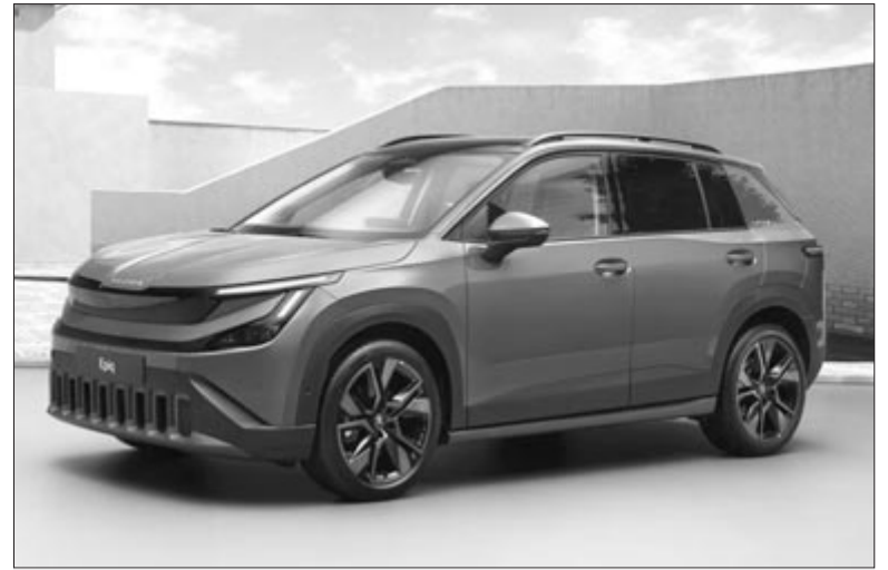
Skoda Epiq, illusztráció