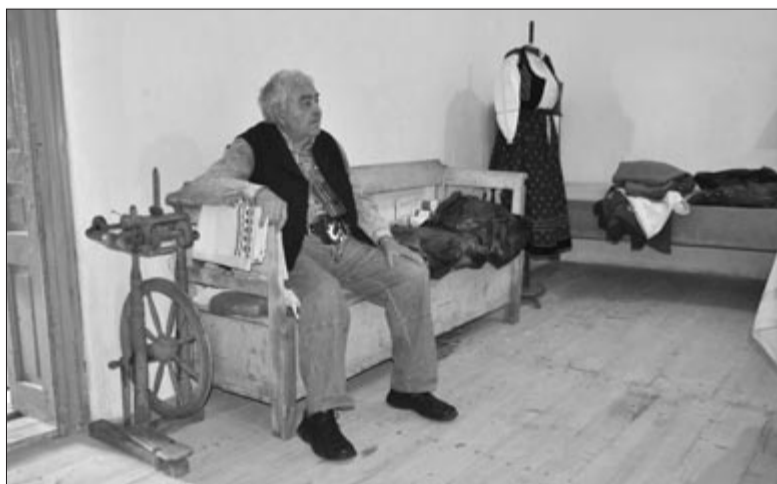
Kallós Zoltán Mikházán

Néhány évvel ezelőtt megalapították a kárpátaljai népzenei képzést, ahol nagy örömeinkre ma már egy virágzó tánc- és zenekultúra élet működik. Ebből is látszik, céljaik, tevékenységük is azonos a Csűrszínházi Egyesület által megfogalmazott célkitűzésekkel. Magyarországon és a Kárpát-medencén kívül felléptek még több európai országban, jártak Venezuelában, Indiában, Görögországban, Mexikóban és az Egyesült Államokban is. A zenekart Kossuth- és Magyar Örökség díjjal is kitüntették, úgyhogy igazán megtisztelő, hogy eljönnek Mikházára, és közösen emlékezhetünk Kallós Zoltánra. Reméljük, annak ellenére, hogy a Marosvásárhelyi Napok rendezvényei zajlanak a városban, sokan lesznek, akik eljönnek, és velük együtt jelezhetjük azt, hogy a népzenevel továbbra is ápoljuk Kallós Zoltán örökségét.