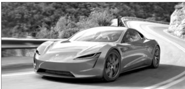
Második generációs Tesla Roadster, koncepció, illusztráció

A Roadster kapcsán azt sem szabad elfelejteni, hogy egyelőre csak a bemutatóról van szó, ennek a megvalósulása is kérdéses, viszont a bemutató után még továbbra is évek fognak eltelni addig, ameddig elkezdődik a gyártás, már ha egyáltalán elkezdődik. Nem mellesleg, az autót eredetileg 2017 novemberében mutatták be prototípusként,