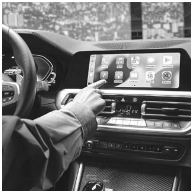
Apple CarPlay, illusztráció