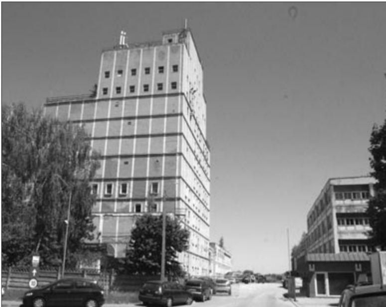
Nem bontják le, hanem átalakítják a toronyépületet

Az Egyesülés negyedben található egykori Fotógyár területe jelentős modernizáláson megy majd keresztül. A tervek szerint a jelenlegi gazdasági övezet vegyes funkciójú városnegyed-központtá alakul át, ahol többek között különböző szolgáltatások, kereskedelmi és vendéglátó egységek, turisztikai,