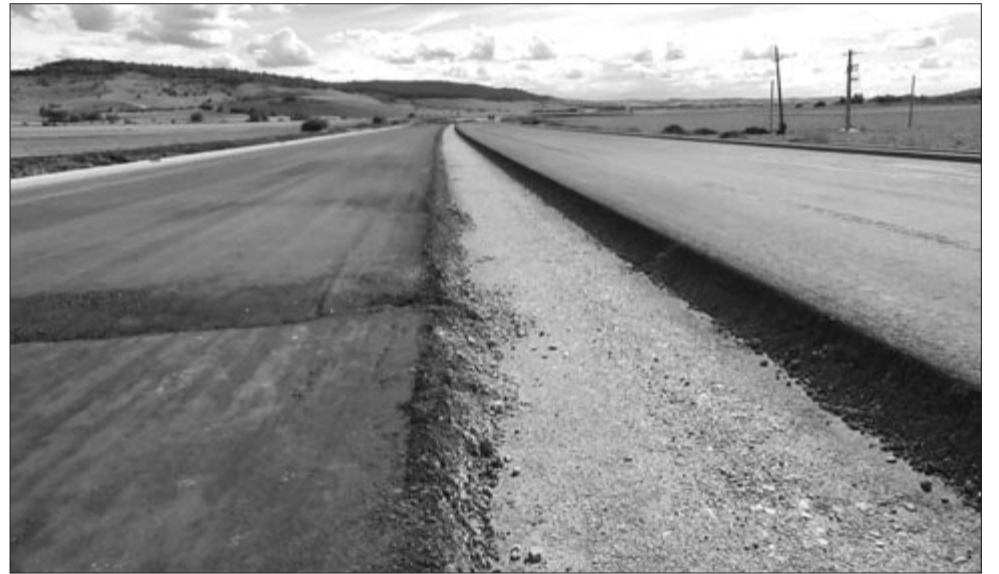
Az első szakaszon, Szentháromság mellett már leterítették a próbaaszfaltozott szőnyeget

számos egyéb tényezővel nem számol(hat)nak pontosan a tervezők: Nyárádszeredában házakat kell elbontani, és lakott területen kell átvinni a nyomvonalat, azután a Kis-Nyárádot és patakot kell áthidalni, vagy azok folyását kell részben módosítani, erdős részt kell letarolni, hogy az irodából tervezett nyomvonalat tartani lehessen, illetve alagutakat is kell építeni a Nyárád és Kis-Küküllő vízgyűjtőjét elválasztó dombvonulaton, az úgynevezett „transzbekecsi” úttal majdnem párhuzamosan, és a nyomvonalat ez esetben is át kell vezetni a 13A jelzésű országúton.