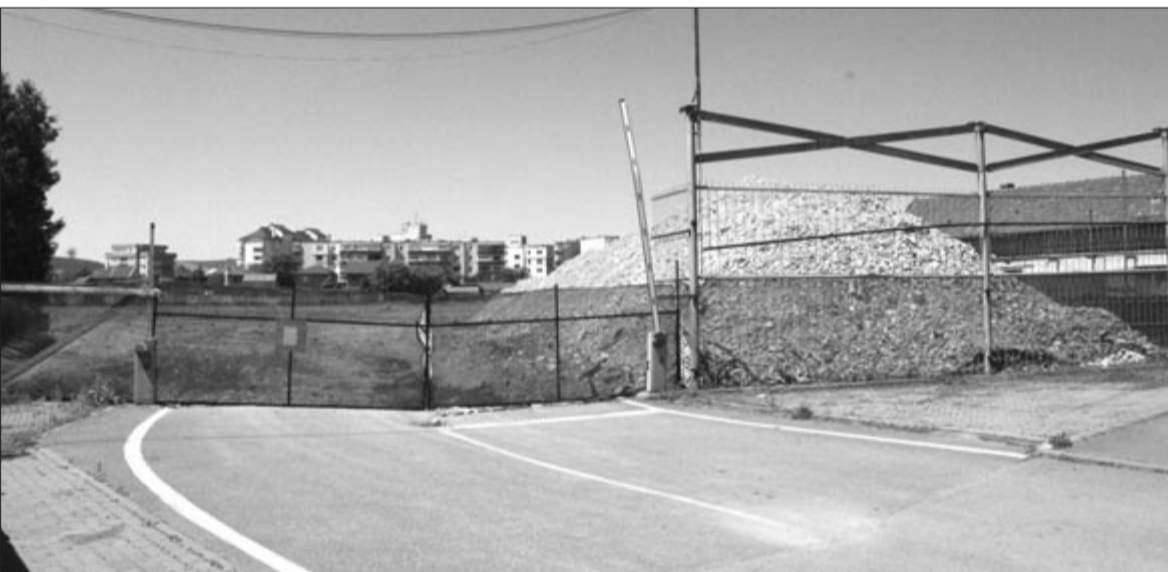
A Romcab egykori bejárata

Ennyit sikerült megtudnunk kintartó érdeklődésünk nyomán. Reméljük, hogy a tervek előreláthatólag tartalmazzák azt is, hogy miként oldják meg a környéken a közlekedést, a parkolást, és azt is, hogy az előírásoknak megfelelően zöldövezeteket is létrehozhatnak. Kétségtelen, hogy az említett fejlesztések miatt szükség van nem egy, hanem több hídra Marosvásárhelyen, mert jelentősen megnő az itt lakók száma, és ezáltal zsúfoltabb lesz a lakónegyed. Továbbra is kérdés marad az, hogy van-e a helyi önkormányzatnak ingatlanfejlesztési tanulmánya, amely pontosabb képet ad arról, hogy az igényeknek megfelelően szükség van-e új panelházak építésére.