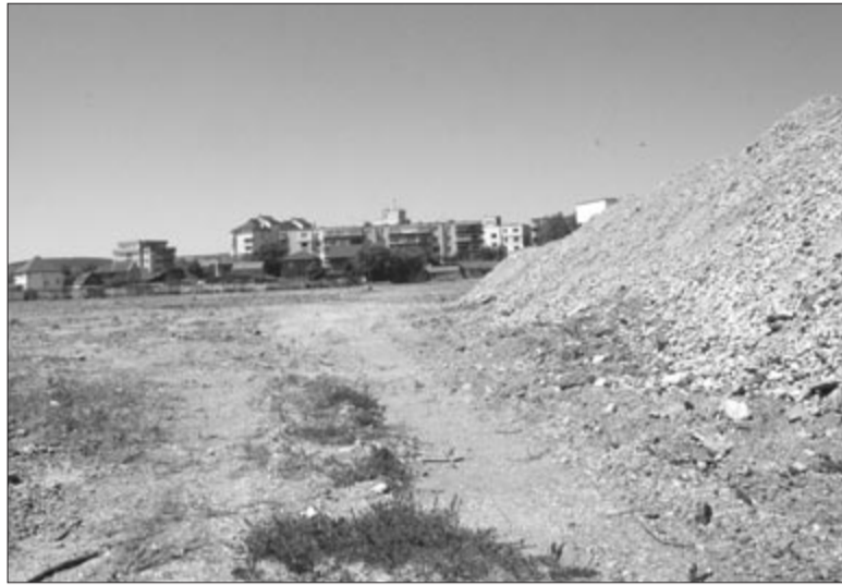
Itt lesz a bevásárlóközpont

Az Egyesülés negyedben zajló egyik legaktuálisabb beruházás az