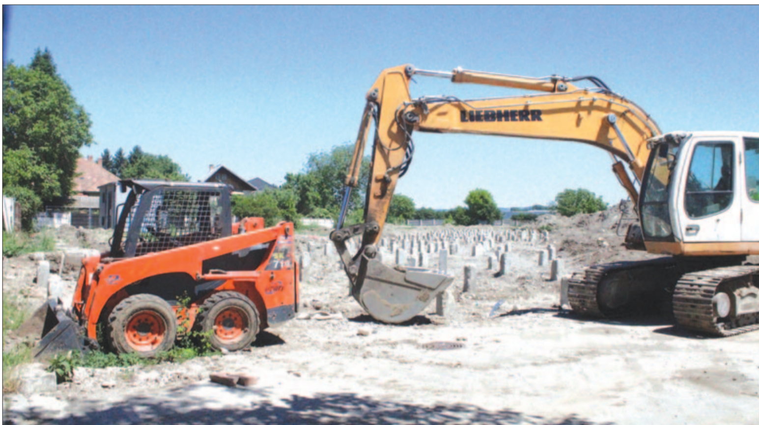
Épül a volt üdítőgyár helyén a lakópark