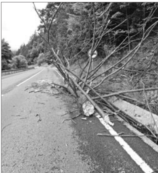
Kidőlt fa Gödemesterháza határában

A Nyárádkarácson községhez tartozó Somosdon szintén a tűzoltókat vetették be a felgyülemlt víz eltávolítására.