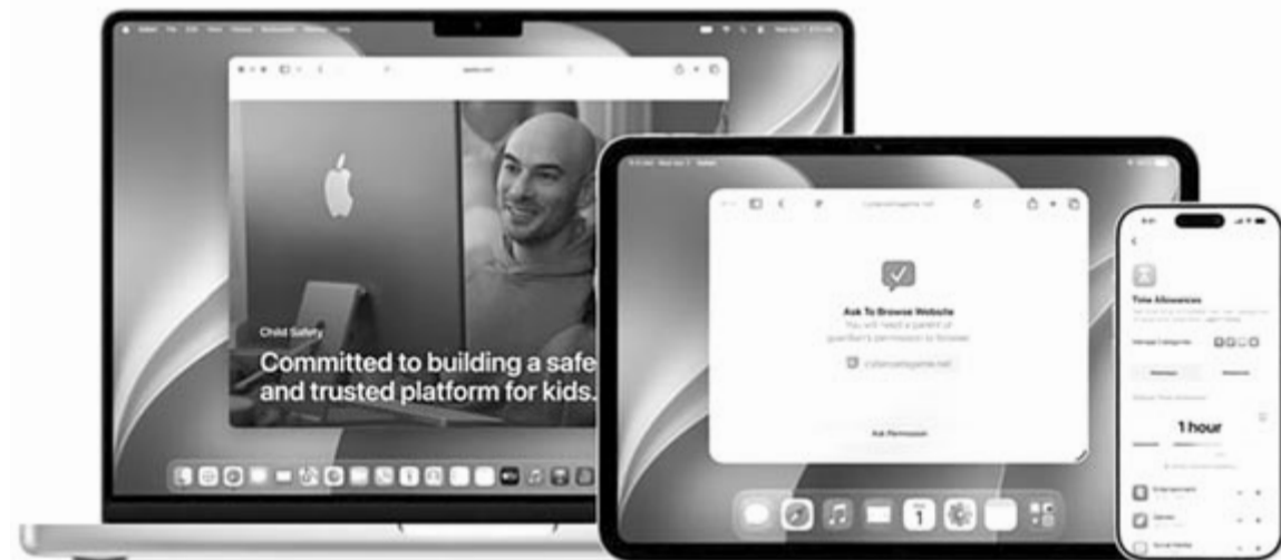
Új macOS és iPadOS, illusztráció

Ahogy eddig sem, úgy ezután sem korlátozódik a Siri csak az iPhone-okra. Macen például segíthet megoldani egy problémát, mert rálát a beszélgetésekre, ennek köszönhetően megfogalmazhat egy levelet a rendelkezésre álló információk alapján. A kereső a macOS esetében képes elindítani a Siri AI-t, ha úgy ítéli meg, hogy az adott keresés már igényli a mesterséges intelligencia