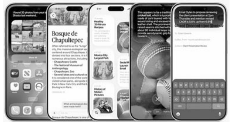
IOS 27, az iPhone-ok új operációs rendszere, illusztráció