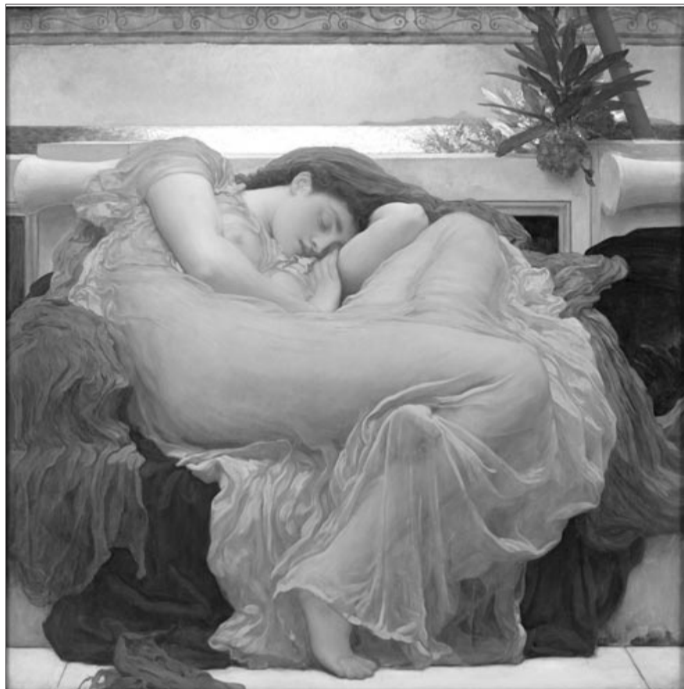
Frederic Lord Leighton (1830-1896) – Lángoló június

1925. július 17-én született Felsőiszkázon a Kossuth- és háromszoros József Attila-díjas költő, műfordító, grafikus, a Digitális Irodalmi Akadémia posztumusz tagja. Elhunyt 1978. január 30-án, Budapesten.