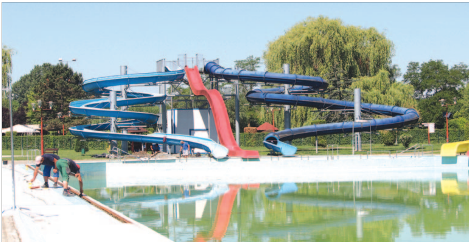
Előkészületek a Víkendtelepen