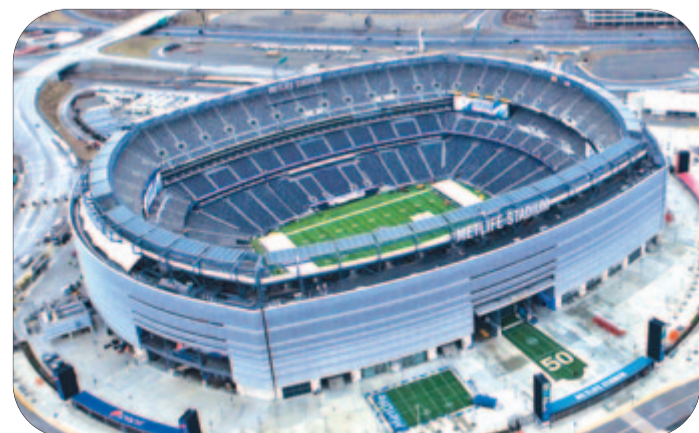
MetLife Stadium, East Rutherford

Bronzmérkőzés 2026. július 19., 0.00 Miami Gardens