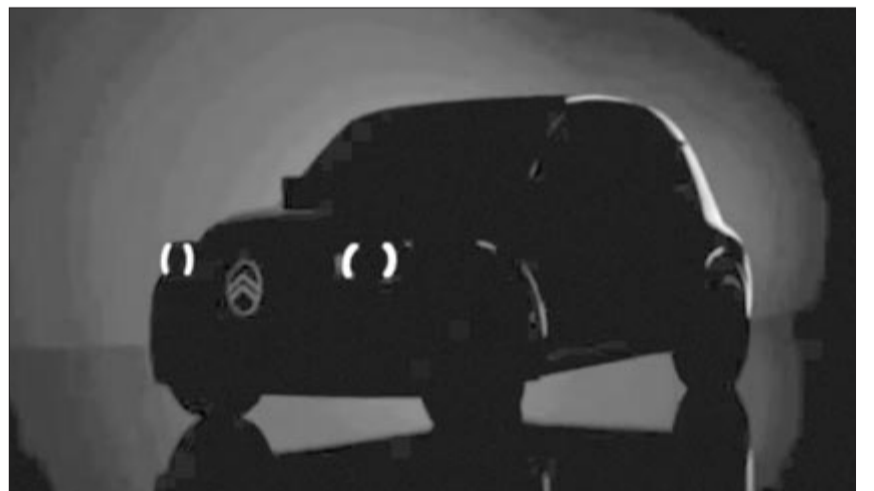
Az új Kacsa sziluettje, illusztráció