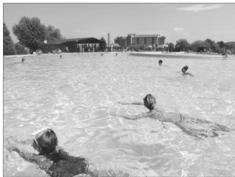
A marosszentgyörgyi strand édes vizű medencéje

A marosszentgyörgyi Apollo Wellness Club strandja június 10-én, szerdán (ma) nyitja meg kapuit