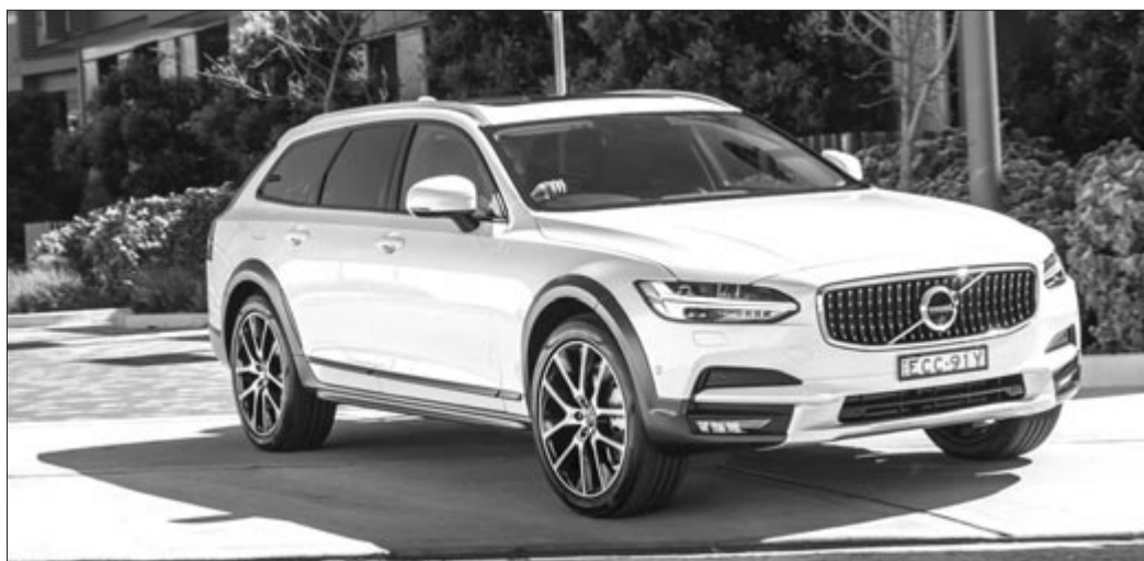
Volvo V90, az egykori svéd márka legnagyobb kombija

Hogy mindez megvalósul-e, az a jövő zenéje. Jelenleg azonban még az SUV az úr, és ez abból is látszik, hogy a Volvo vezérigazgatója egy hobbiterrepjáró bemutatóján osztotta meg ezeket a gondolatait, ahol nem mellesleg azt is megszelídítette, hogy a márka dolgozik egy újabb SUV-n, amely kapcsán ugyan konkrétumokat nem árult el, azt azonban elmondta, hogy egy olyan autó készül, amellyel minden bizonnyal komoly szemetet fognak kiharítani az amerikai piacból, és alaposan felpörgetik a dél-karolinai üzemük gyártáskapacitását. Nem kell túl nagy képzelőerő ahhoz, hogy rájövünk: egy újabb hatalmas SUV van készülődésben, amely kapcsán különféle pletykák már hosszú ideje szárnyra keltek. Utóbbiak értelmében a Volvo egy, az XC90-nél is nagyobb SUV piacra dobását tervezi; egy kifejezetten három ülésos autóról lehet szó, amellyel a Mercedes-Benz GLS-nek és a Cadillac Escalade-nek állít versenytársat. Sőt a Volvo újdonsága potenciálisan riválisa lehet a hamarosan érkező Audi Q9-nek is. További érdekesség, hogy meg nem erősített iparági pletykák szerint a BMW is tervez egy hasonlóan nagy méretű SUV-t az amerikai piacra.