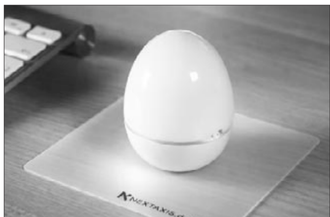
A tojás alakú egér

Az elmúlt években számtalan formájú egér jelent meg a piacon, ezek között voltak egészen különlegesek is, azonban egyik sem érhet fel a tojás alakúval. Az ígéretek szerint az egér kímélte volna a csuklót is, azonban hiába a kuriózumhatás, a számítógépes közönség elvetette az opciót.