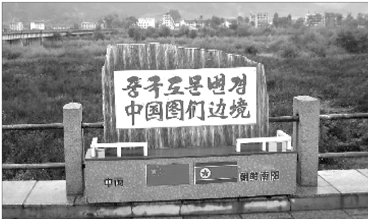
Határkő Kína és Észak-Korea határán