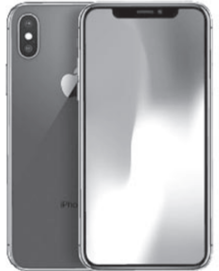
iPhone X, a tízéves jubileumra készült iPhone, illusztráció

Gyaníthatóan viszont nem a kijelző lesz az egyetlen újdonsága a 20. születésnapját ünneplő iPhone-nak. Erőteljes az a megérzésünk, hogy készül valamivel még az Apple, lesz még valami nagy dobás, legalábbis, ha tényleg emelt fővel akarják megünnepelni azt az eszközt, ami a legtöbb pénzt hozza a cégnek. Azonban azt egyelőre nem tudni, hogy milyen