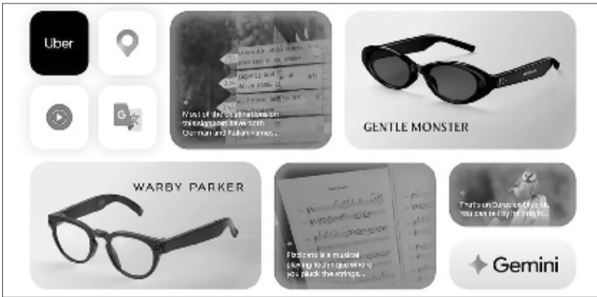
Samsung-Google közös okos szemüveg, illusztráció

Az okos szemüvegről már hosszú évek óta lehet pletykákat hallani, illetve, ha visszagondolunk a '90-es évek rajzfilmjeire, ott is nem egy alkalommal megjelent. Sokan sokáig úgy gondolhatták, hogy még nagyon messze van az a pillanat, amikor valósággá válik. Aztán jött az Oculus, és megalkotta az első, széles körben elterjedt VR-szemüveget (virtuális valóság szemüveg), ezt követték különböző AR, azaz kiterjesztett valóság szemüvegek, aztán jött az Apple a kevert valóság szemüvegével. Azon-