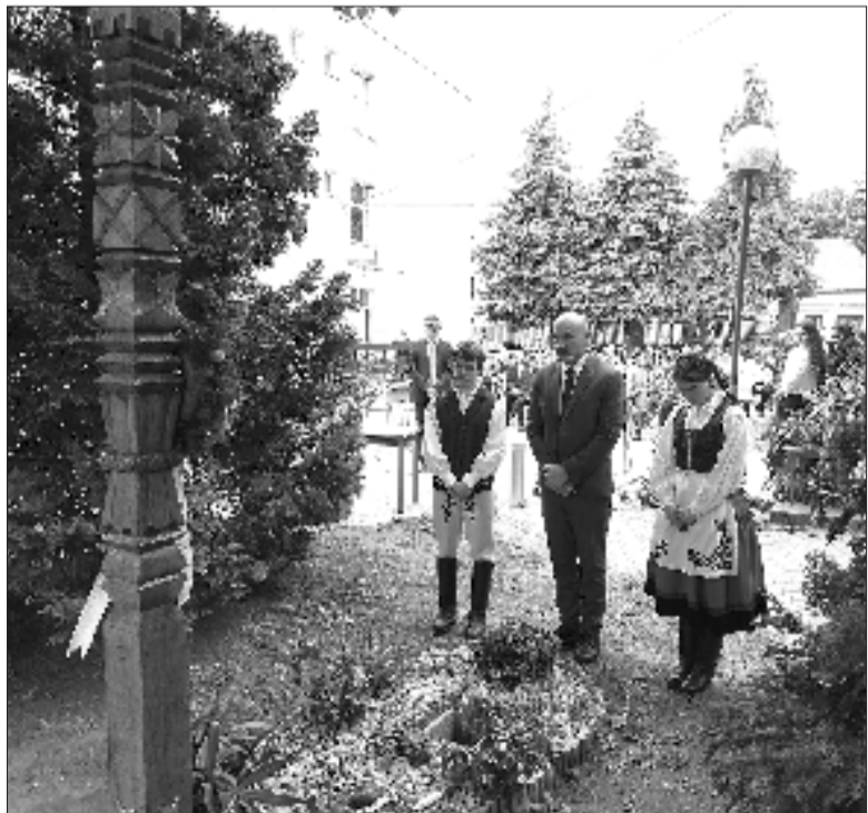
A szeredai iskola képviselői is tisztelegtek a Székesfehérváron közösen felállított kopjafa előtt

Technikum, Szakképző Iskola és Kollégium fennállásának 140. évfordulója alkalmából rendezett ünnepségén, amely jubileum a múltidézés mellett a jövőnek is szólt, az ünnepség keretében idő-kapszulát is elhelyeztek. „A nemzeti összetartozás napja alkalmából egy igazán szimbolikus és szívmengető pillanatra is sor került: felavatóra került a két iskola által közösen készített kopjafa, amely az erdélyi testvériskolánk udvarán álló mementó hű másolata. Ez a kopjafa mostantól itt, nálunk is hirdeti, hogy a határok elválaszthatnak, de a lélek és a közös gyökerek összekötnek bennünket” – számolt be közösségi oldalán az anyaországi iskola.