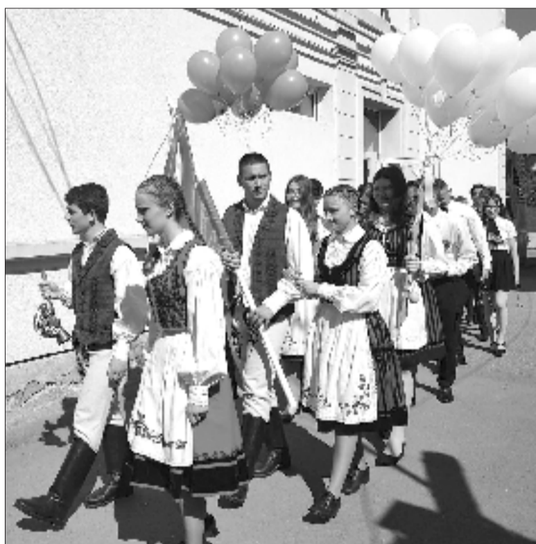
Három vidéki magyar középiskolában is elballagtak a diákok

A tizenkettedikes diákok szép és meghatározó gesztussal búcsúztak osztályfőnöküktől, majd a négy végzős osztály kört formálva égnek eresztette a piros, zöld, fehér és kék színű léggömbjeit, s ahogy azok elszáll-