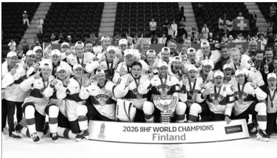
Az aranyérmes finn csapat ünnepel a bajnoki tróféával

A svájciak ötödik döntőjüket is elveszítették, továbbra is vb-cím nélkül vannak.