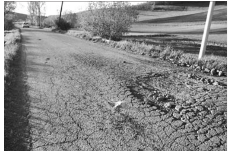
Néhány nappal ezelőtt még ilyen volt a helyszín – mára már eltakarították a törmeléklet

A polgármester elmondta azt is, hogy a néhány évvel ezelőtt leaszfaltozott útszakasz jótállási időszaka lejárt, tehát nekik kell már ezt a hibát kijavítaniuk, de nem szándékoznak egyelőre új réteget leteríteni a községi úton. Aszfaltozási terv sem készült egyelőre, hiszen Székelymosonban hamarosan elkezdődik a közművesítés, s befejeztével elsősorban a mellékutakat szeretnék szilárd burkolattal ellátni. (GRL)