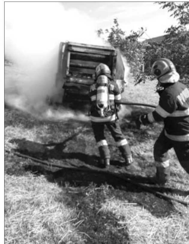
Az égő bálázógép

Május 30-án este a marosludasi tűzoltókat Marosbogátra, egy kigyulladt bálázógép oltásához riasztották. A helyszínre egy víz- és haboltóval felszerelt tűzoltóautó, valamint egy SMURD mentőegység vonult ki. A tüzet sikerült eloltani. A mezőgazdasági gép több alkatrészre megsemmisült, személyi sérülés nem történt. (szer)