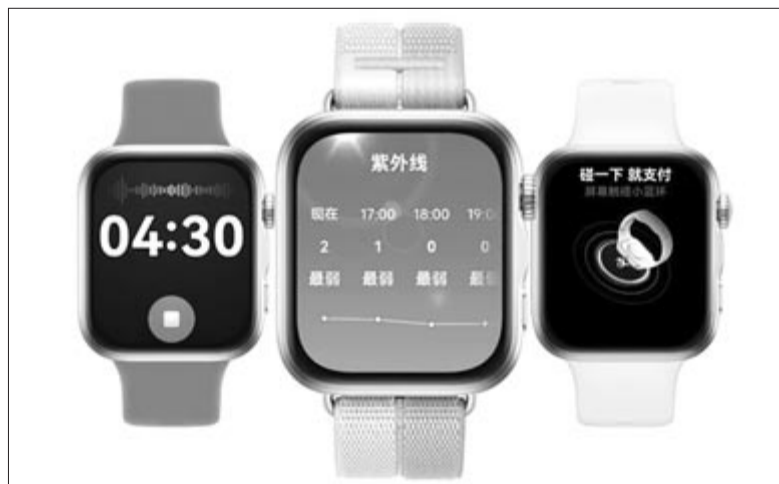
Huawei Watch Fit 5

delkező eszközök nagyban hasonlítanak a 2025-ös Watch Fit 4 széria modelljeire, de nem kell nagy változásra számítani, inkább csak egy amolyan ráncfelvarrásra.