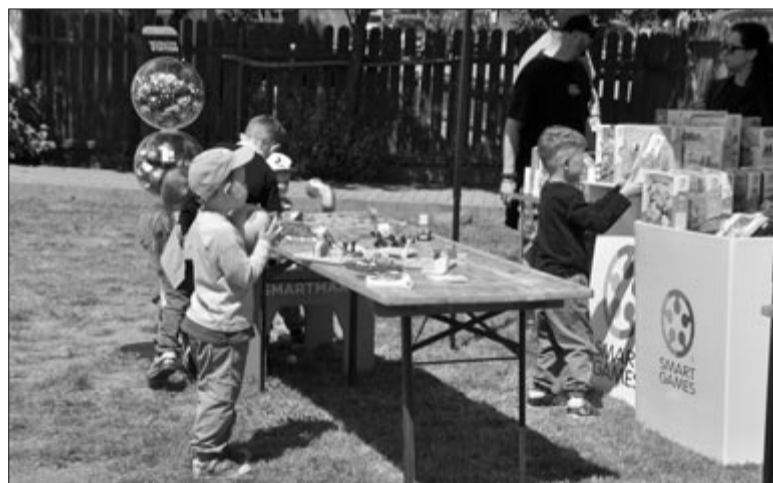
Társasjátékstand a mikházi gyereknapon