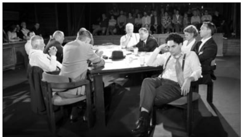
12 dühös ember