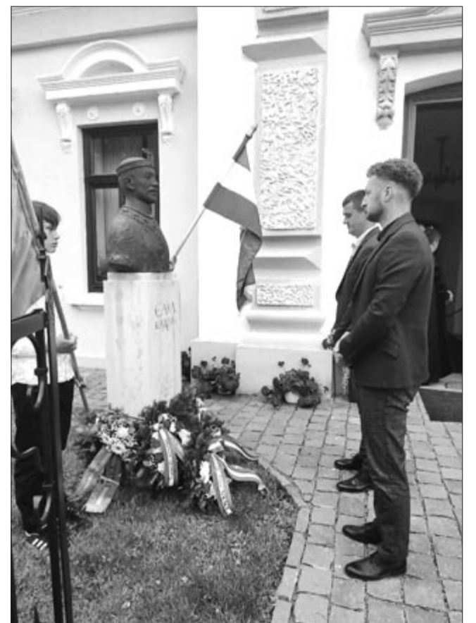
Idén is elhelyezték Csaba királyfi szobránál a tisztelet koszorúit

„A mai ünnep megtanít felfele nézni. Szó szerint is, hiszen amikor a templom előtti zászlórúdra felvonjuk a székely zászlót, a tekintetünket a magasba emeljük, és lélekben is felfele nézünk, hiszen minden ünnep és minden istentisztelet felfele, azaz Istenre irányítja a tekintetünket, akinél ott van személyes életünk, anyaszentegyházunk, valamint népünk, nemzetünk megtartása” – hirdette Tőkés Attila lelkipásztor az ünnepi alkalmon.