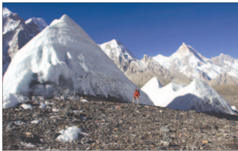
Jéggulák a gleccseren (háttérben jobbra a 7821 m-es Masherbrum)

ségű, hegyes jéggulák közt kapaszkodtunk, emeletes ház nagyságuk mellett eltörpültünk. Ám ez a nap leginkább a hegycsúcscsupersztárok miatt vált feledhetetlenné. Döbbenetes panorámák tárultak elének. A közel 8000-es Masherbrum csak úgy sziporkázott a napsütésben, de hamarosan megpillanthattuk a 7273 m-es Muztagh Towert, amelyet sokáig a Karakorum utolsó, megmászhatatlannak hitt fellegvárának tartottak. Majd feltűnt a 7422 m-es Sia Kangri, amely azért is érdekes, mert bár a pakisztáni–kínai határon fekszik, mindössze egy kilométernyire található attól a hármas határtól, ahol a Pakisztán, Kína és India által ellenőrzött országterületek összefutnak. Ezek olyan területek, ame-