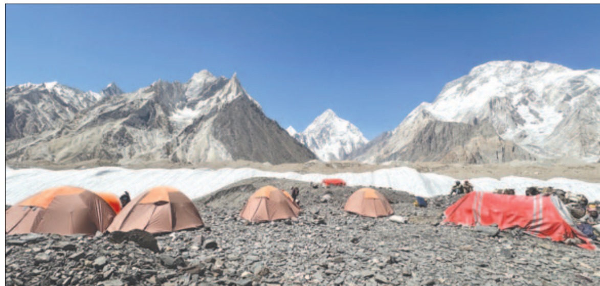
Panoráma a Concordia táborból. Középen a K2 (8611 m), jobbra a Broad Peak (8051 m)