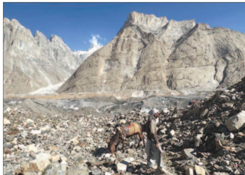
A Baltoro-gleccseren nincs mit legelni

mit beszélek, hiszen most, e sorok írásával is éppen ezt teszem. Még órákig bámultam volna, ha a hideg nem lopózik be észrevétlenül dermesztő szárnyain a sátor zugain keresztül a csontjaimba. Még volt annyi erőm, hogy minden ruhámat magamra vegyem, és elveszek a puha, meleg hálósákomban. Ez az éjszaka is csípősnek ígérkezett.