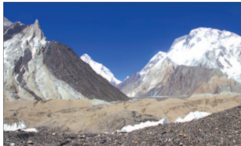
Kezdi megmutatni magát a K2 (középen), jobbra a Broad Peak (8051 m)

Hétórányi küzdelmes menetelést követően, éjszakánkat az ösvény legfontosabb táborában, a Concordiában töltöttük, 4512 m-es magasságban. Sátrinkat úgy tájolták, hogy bejártuk a K2-re nézzen, ezért feltekertem a bejárati ponyvát, befeküdtem a sátorba, hogy fáradt csontjaimat, törődött testemet vízszintesbe helyezve pihentessem, s közben a világ egyik leghihetlenebb, leglelkesítőbb, csak keveseknek megadatott látványát bámulhassam. Érintésnyire voltam a világ második legmagasabb hegy-csúcsától, szemeimet újra és újra a hegyekre emelhettem. Felfoghatatlan volt. Bárcsak meg lehetne hosszabbítani az ilyen pillanatokat! De