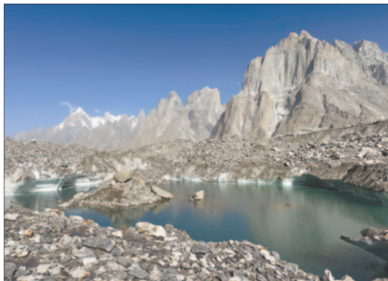
Gleccsertó a gleccser hátán

műveleten. Na, de vissza is kellett találnom a karakorumi éjszaka sötétjében. De hogyan? Úgy elgyengültem, hogy egyszerűen nem tudtam talpon maradni az összevissza emelkedő és lejtő talajon, imbolygó köveken. Térde rogytam, és négykézláb próbáltam visszamászni a sátorba. Közben pánikszerűen futott át oxigénhiányos elmémen, hogy mi lesz, ha nem találok vissza, vagy ha nem lesz erőm visszakúszni. Édes Istenem, mi lesz, ha elájulok? Ki fog megtalálni? Reggelig ott fogok feküdni kinyúlva a köveken, talán még meg is fagyok, mire rám találnak. Ekkor eszembe jutott, hogy a zsebemben van a telefonom, s megnyugtatt az a tudat, hogy vészhelyzetben felhí-