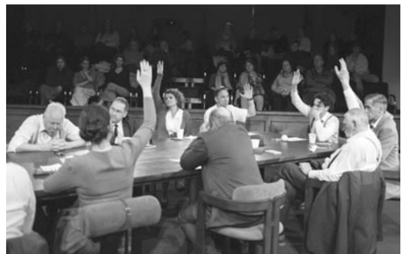
12 dühös ember