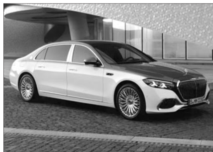
Maybach S680, illusztráció