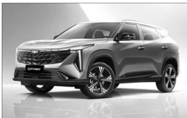
Geely Cityray, illusztráció

Az összeállításból pedig nem szabad kihagyni egy érdekességet: a Chery-t, amelynek az új energiaszektornál járművei (NEV) először lépték át a 100.000 darabos küszöböt, egész pontosan 100.276 darab kelt el belőlük. A Chery egyébként is jól kezdte az évet, hiszen márciusban világszerte 240.678 járművet adott el, negyedéves összesítésben pedig 601.712 darabig jutottak. A globális Chery-felhasználók száma ezzel 19,12 millióra nőtt, míg a nemzetközi terjeszkedést jól jelzi, hogy közülük 6,23 millióan nem kínaiak.