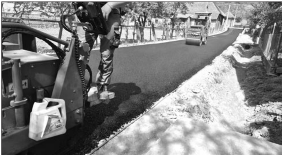
Az első aszfaltréteget már leterítették, hamarosan következnek a második

biztosítása nem zökkenőmentes, hiszen minden összeg, amelyet a helyi költségvetéstől kell elvonni különböző projektekre, már gondot kezd jelenteni a község számára – tette hozzá a település elöljárója. (GRL)