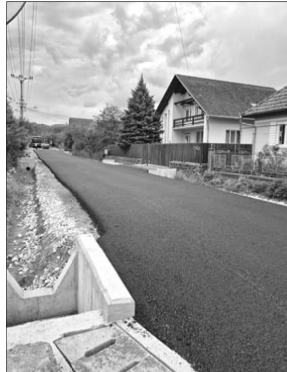
A csapadékvíz elvezetése érdekében módosítani kellett a terveket