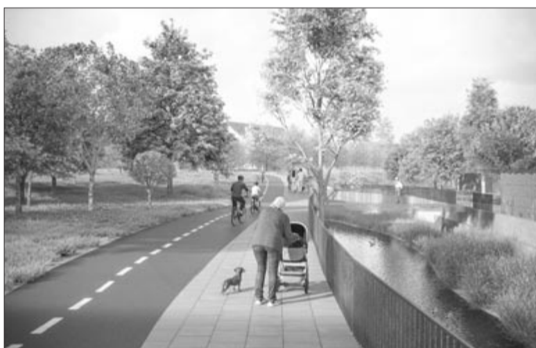
A pályázat látványtervei

A bíráló bizottság az alábbi díjakat osztotta ki: az I. helyezett pályadíj értéke nettó 228.199,50 lej (héta nélkül) + a városépítészeti tervre vonatkozó szerződés becsült értéke nettó 14.952.128,21 lej (héta nélkül) (a tervezési szolgáltatások díjának becsült felső határa: nettó 15.180.327,71 lej héta nélkül). II. hely 177.488,50 lej; III. hely 126.777,50 lej; IV. hely 76.066,50 lej – I. dicséret; V. hely 76.066,50