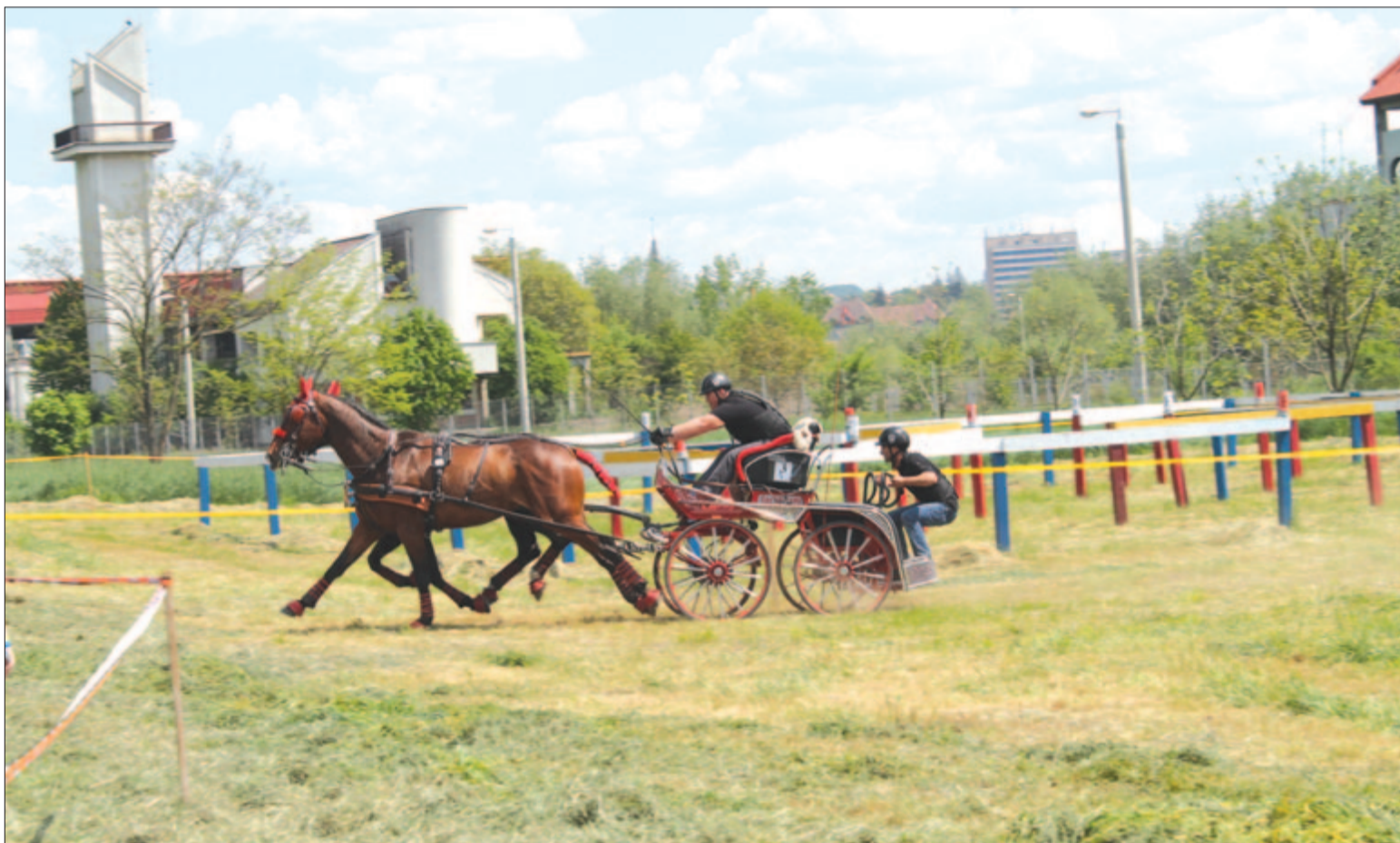
Nem cél a lovarda megszüntetése