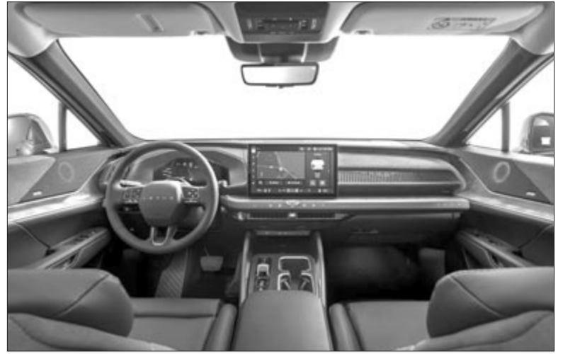
Lexus TZ beltér