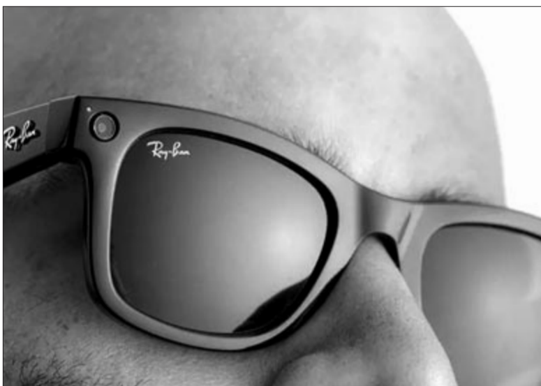
Kamerás Ray Ban szemüveg, illusztráció

Az internet tehát gyors átalakuláson megy keresztül a szemünk előtt, ennek pedig fő mozgatórugója a mesterséges intelligencia. Ez a változás bár gyorsabb és kényelmesebbé tesz bizonyos folyamatokat, a biztonság szempontjából mégsem nevezhető jó hírek, egyáltalán nem. Jó kérdés, hogy hogyan húznak majd kesztyűt az újfajta csalásokkal szemben a kiberbiztonsági szakemberek. Bármilyen is lesz a szakemberek válasza, nagyon fontos, hogy elővigyázatosan és kritikus gondolkodással használjuk a világhálót, mert a csalások száma, sajnos, borítékolhatóan növekedni fog, folyamatosan.