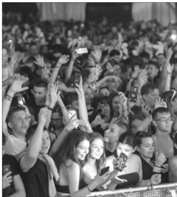
Telt házas buli a Vibe fesztiválon, illusztráció