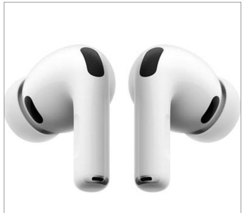
AirPods Pro, harmadik generáció, illusztráció