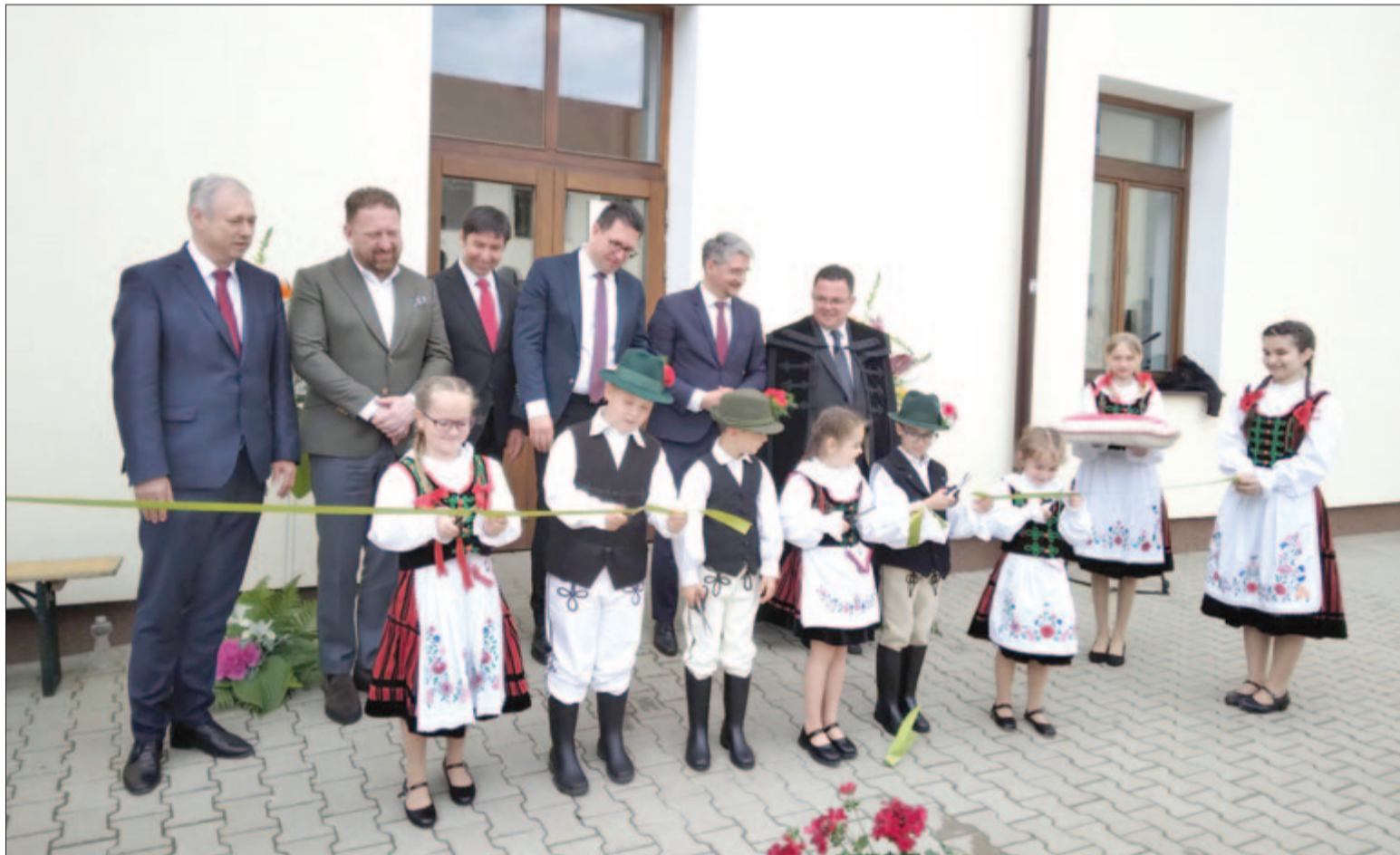
Az avatóünnepségen elvágják a szalagot