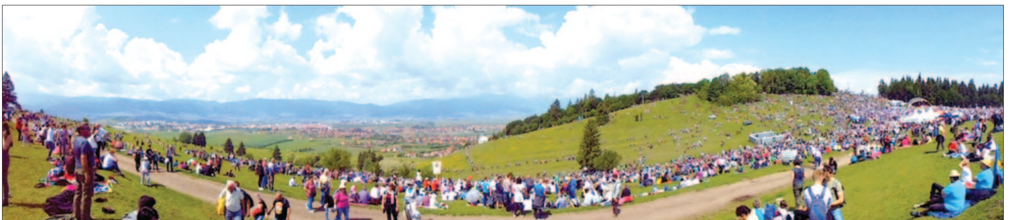
Áldott pünkösödhöz szép időt!