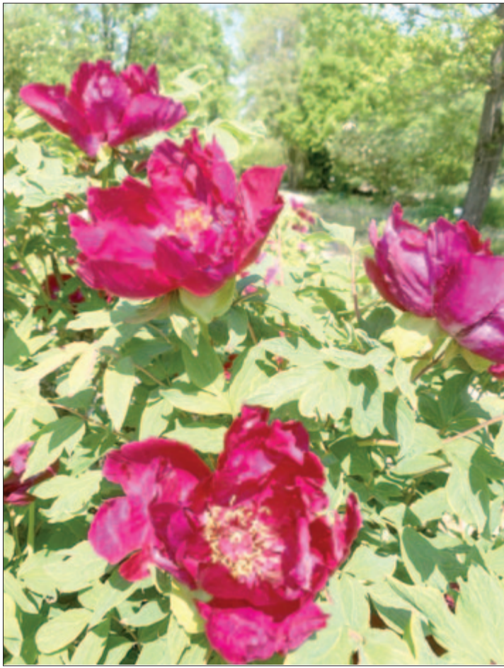
Amikor a lány talpig bazsarózsa