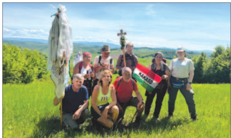
Ez a magyarországi csapat 40 napos gyalogos zarándoklatot vállalt