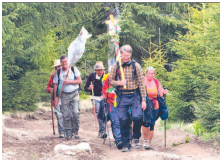
Nem a körülmények, hanem a cél a fontos az úton

Nem csak az válik a zarándoklat részévé, aki hosszabb-rövidebb útra vállalkozik, hanem az is, aki az úton levőket jó szóval, hústító itallal, finom falattal várja az útvonal mentén. Számos állomás- és szálláshelyen volt részük bőséges ellátásban a zarándokoknak, sok helyen nemcsak a plébániákon, hanem magán-személyek, vendéglátósok is megkínálják az érkezőket. A gyula-kutai Trója étterem például egy tál meleg ételt kínál fel minden olyan gyalogos zarándoknak, aki a napokban Csíksomlyó felé igyekezve áthalad a településen.