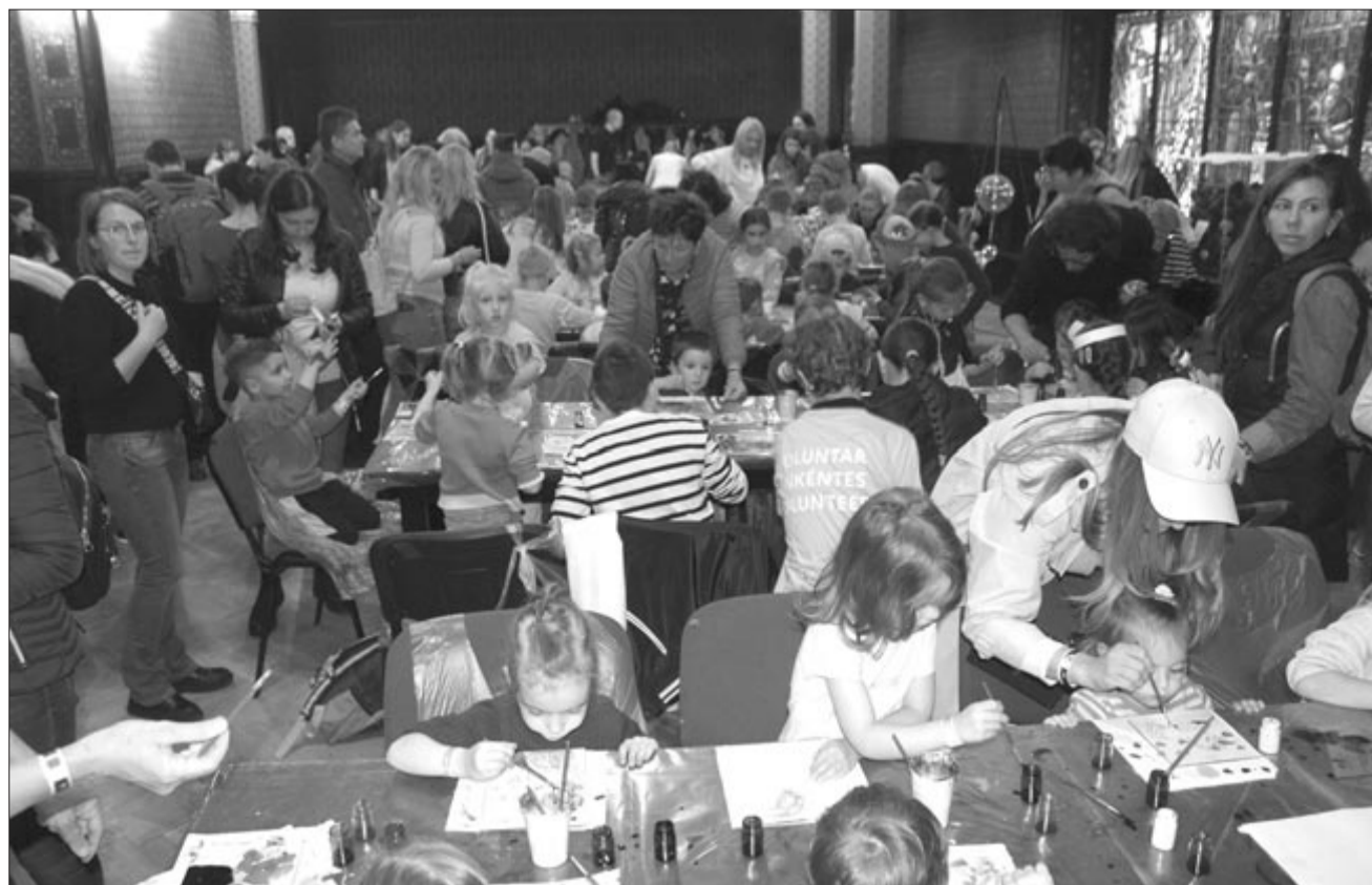
Múzeumpedagógiai foglalkozások a tavalyi rendezvényen

11.00–21.00 „Hősök közöttünk” | bemutató a bevetések során alkalmazott operatív technikákról és felszerelésekről