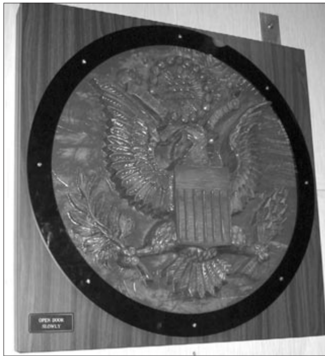
A faragott pecsét – immár kiállítva az NSA Nemzeti Kriptográfiai Múzeumban

A tudós szorult helyzetében elképesztő technikát eszelt ki: elektromos táplálást nem igénylő eszközt épített, melyet kívülről mikrohullámokkal működtettek, és sem röntgennel, sem egyéb eszközzel nem lehetett kimutatni a jelenlétét. Már csak az volt hátra, hogyan juttassák be az amerikai nagykövetségre. Épp kapóra jött 1945. július 4-én Amerika függetlenné válásának ünnepnapja. Egy szovjet iskoláscsoport nagy méretű, fából faragott Amerikai Egyesült Államok pecsétjét