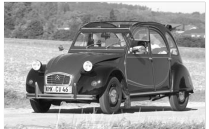
Citroën Kacsa, a 2CV, illusztráció

A Citroën vezérigazgatója továbbá úgy fogalmazott: „Elég szomorú, hogy az elmúlt öt évben több mint két évvel nőtt az autók átlagéletkora. Európában most 12 év felett van az átlag. Ezért kell ösztönözni az embereket arra, hogy új autót vásároljanak, de ehhez az kell, hogy ezek megfizethetők legyenek”.