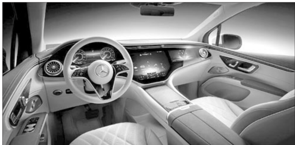
Mercedes-Benz beltér, illusztráció

Adalék a történehez, hogy a Mercedesnél a nagy kijelzők korszaka valahol az EQ-széria bevezetésénél kezdett elharapódzni. Bár annak már hivatalosan vége, az olyan potens újdonságok, mint a CLA, a GLC vagy a GLB szintén nem úszták meg a nagy kijelzőket, sőt, egyre több és egyre nagyobb panelek kerülnek az autókba az MBUX Super Screen név alatt. A legutóbb a Mercedes ezt a frissen bemutatott C osztállyal emelte ismét váratlan magaslatokba.