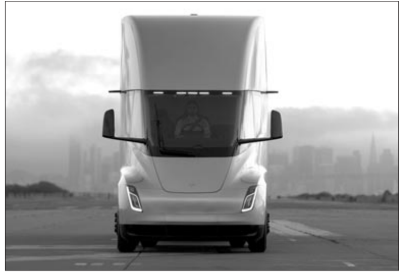
Tesla Semi, illusztráció

Ha pedig már a két változatnál tartunk: még az év elején jelentették be, hogy kétféle változat készül a Semiből, ezek között – a tömeg mellett – a hatótáv jelenti a különbséget. A Standard Range változat nagyjából 520 kilométer, míg a Long Range változat mintegy 800 kilométer megtételére képes. Ehhez pedig társul a töltés is. Az 1,2 MW-os Megacharger-töltésnek köszönhetően az akkumulátorszint 30 perc alatt képes felkapaszkodni