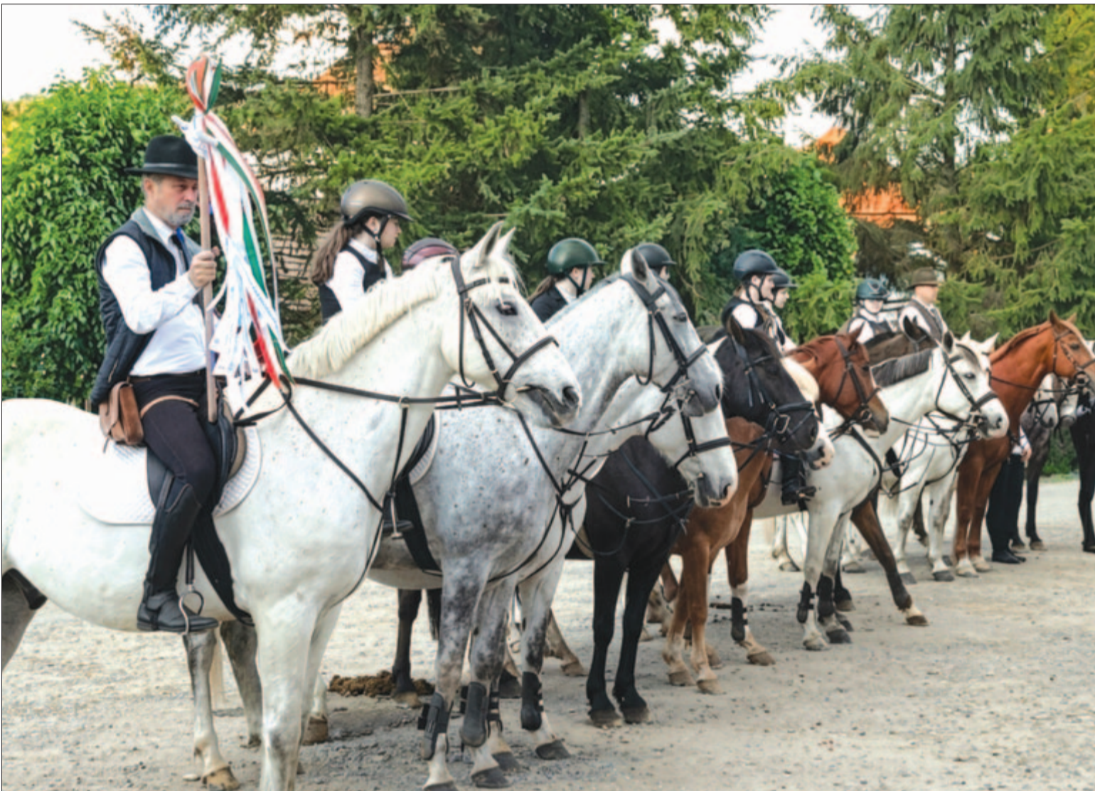
A tíz lovas zárándok a pünkösdi búcsún járul az üzenetekkel, imákkal a Szűzanya elé