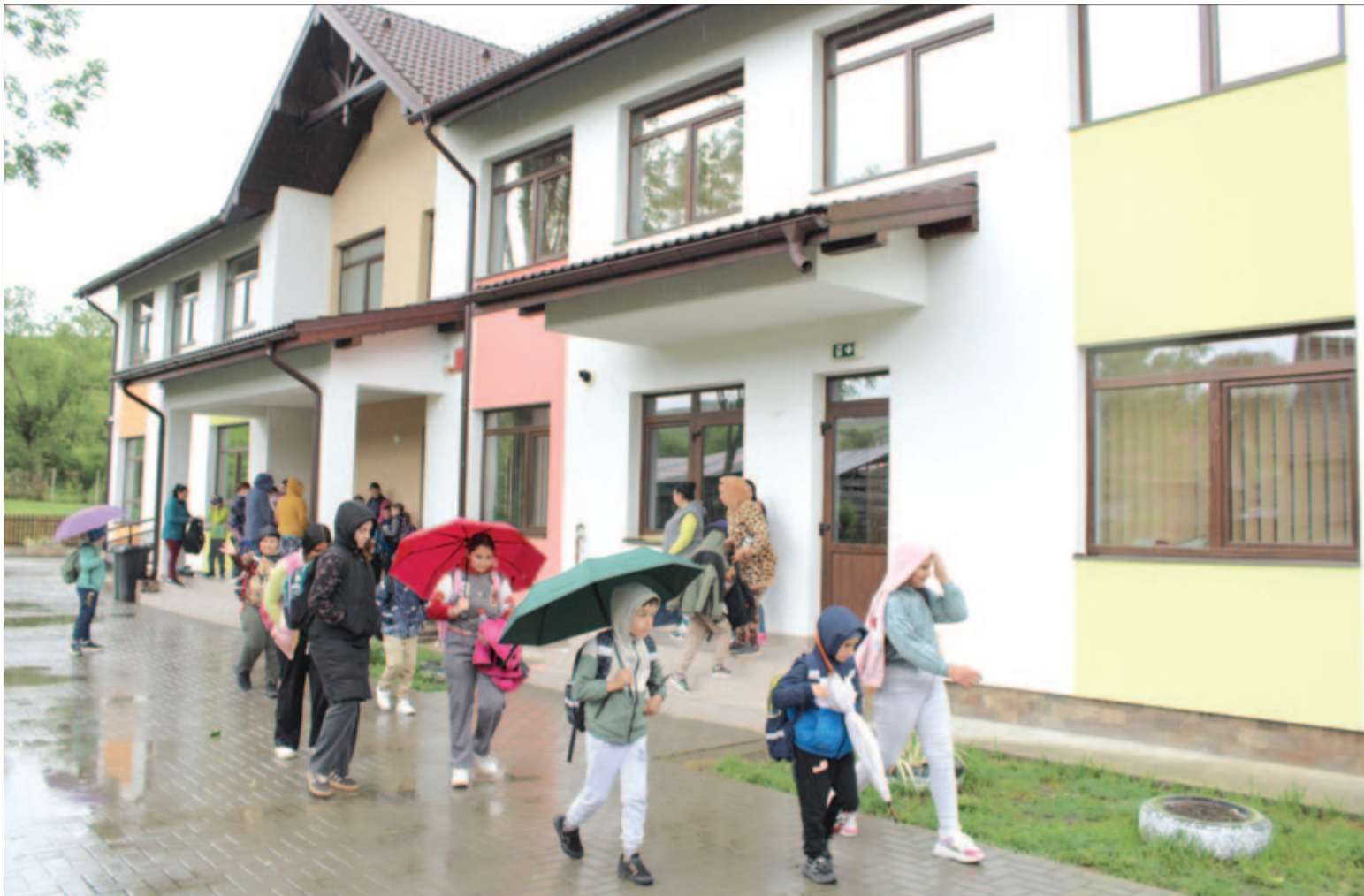
Mikefalvi összeállításunk a 6. oldalon