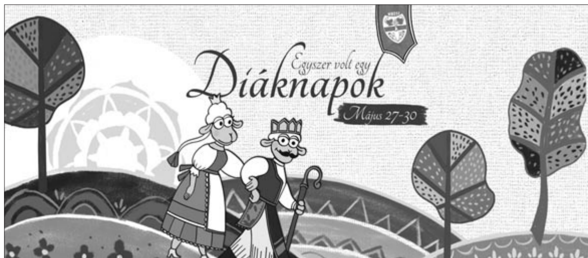
A Marosvásárhelyi Diáknapok plakátja

A szervezők bíznak abban, hogy minden résztvevő, akár aktív, akár külsős, jól fogja magát érezni az idei diáknapokon, illetve reménykednek benne, hogy az időjárás idén velük fog tartani, nem lesz szükség a gumicsizmákra.