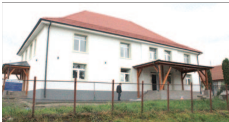
A désfalvi kultúrotthon

Haranglábban a hulladékudvar 5.165.000 lejből 96%-ban elkészült, az országos helyreállítási terv (PNRR) keretében megvalósított pá-