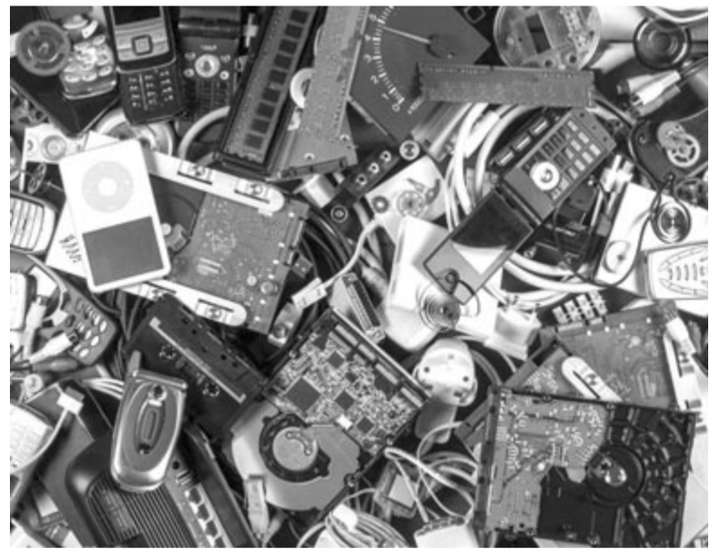
Elektronikai hulladék, illusztráció

Bizonyos esetekben azonban nem kötelező a felhasználó által cserélhető akku használata. Olyankor például, ha ezzel a készülék vízállósága vagy biztonsága sérülne, esetleg a designt nem lehet egyszerűen átalakítani. A TechRadar úgy tudja, hogy a rendelet azokra az akkumulátorokra sem vonatkozik, amelyek ezer ciklus után is megtartják 80 százalékos kapacitásintéjük. Tulajdonképpen a gyártó választhat, hogy könnyen cserélhető vagy nagyon tartós akkut tesz eszközeibe. Az Apple-nek tehát nincs miért aggódnia, hiszen hivatalos támogatási dokumentumai szerint a 2023-as iPhone