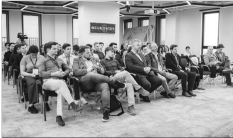
Harmadik MIÉRT Green Team konferencia résztvevői