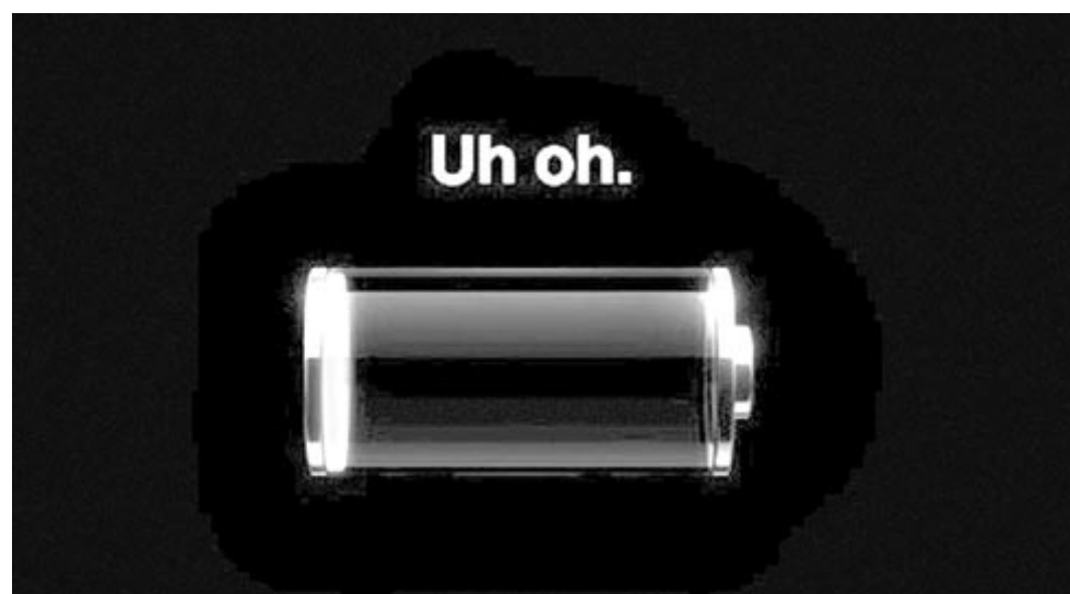
Lemerült telefonakkumulátor, illusztráció

További kérdés, hogy ha elkészül a szoftver a hardverhez, az Apple engedélyezni fogja-e a korábbi készülékeken, hiszen az már bizonyos, hogy a technikai rész 2020 óta benne van a telefonokban. Azonban erre tényleg mikroszkopikus az esély, hiszen soha nem árt még egy olyan tényező, amely arra ösztönzi a vásárlót, hogy váltsa az újabb, éppen aktuális készülékre.