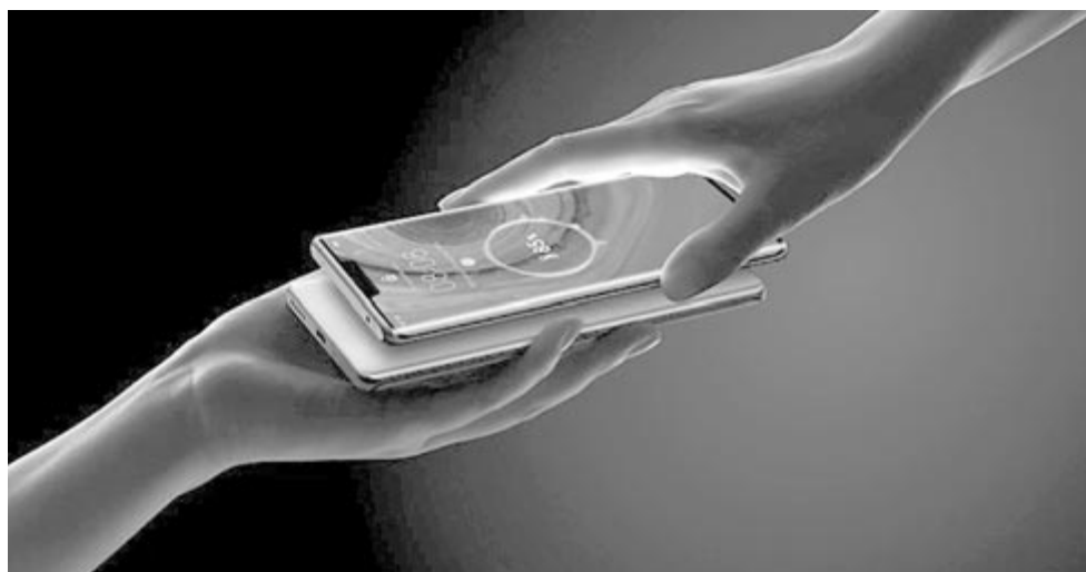
Fordított töltés, illusztráció