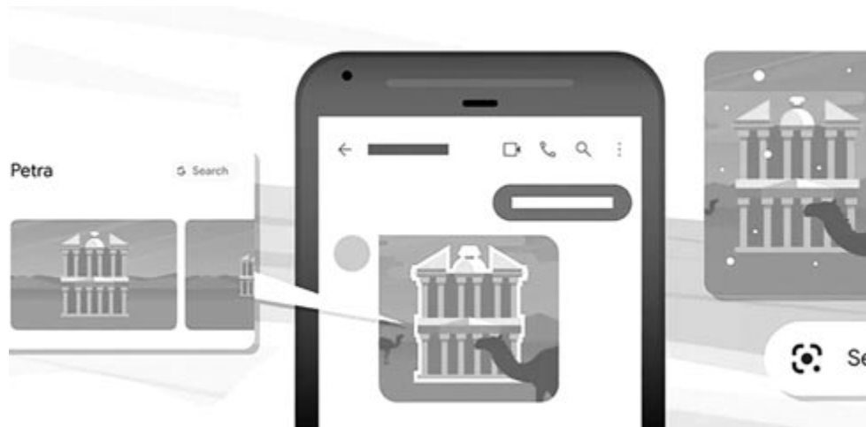
A Google újdonságai, illusztráció

információ, azonban erre egyelőre nem került sor. Mindössze annyit lehet tudni, hogy egy kísérleti, párbeszédre is képes mesterséges intelligencia alapú szolgáltatásról van szó, amely a Google meglévő nyelvi modelljére épül, és több mint két éve fejlesztik. A Google szerint a következő hetekben elérhetővé teszik a ChatGPT riválisát, amely képes lesz a felhasználók szélesebb körét megmozgatni. Egy biztos: ha a Google meg akarja őrizni piacvezető szerepét, kénytelen lesz komolyan belehúzni a fejlesztésbe, mert a mesterséges intelligencia alapú rendszerek már most is sok esetben relevánsabb válaszokkal szolgálnak.