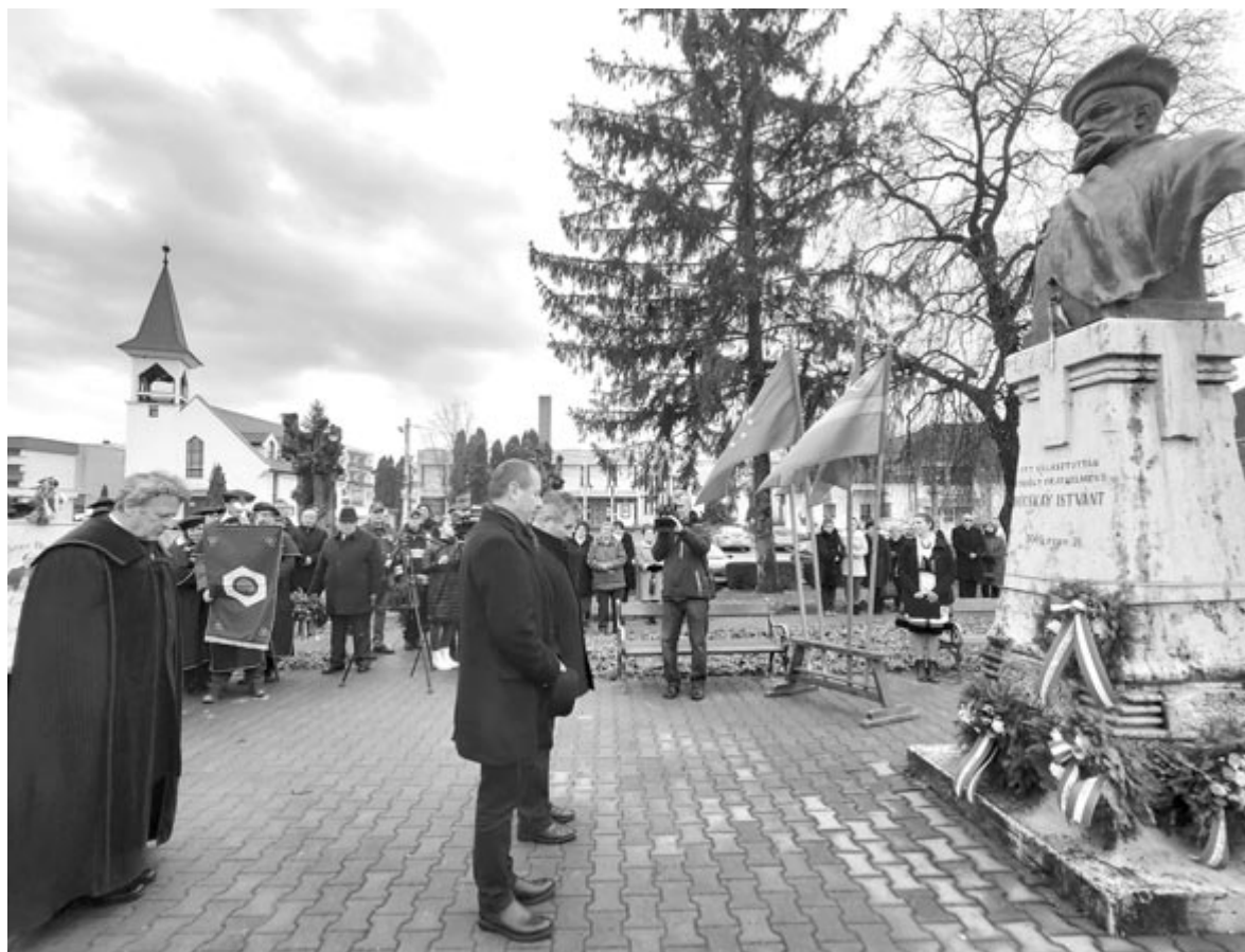
Harmincadára tisztelgették Nyárádszeredában a fejedelem szobra előtt