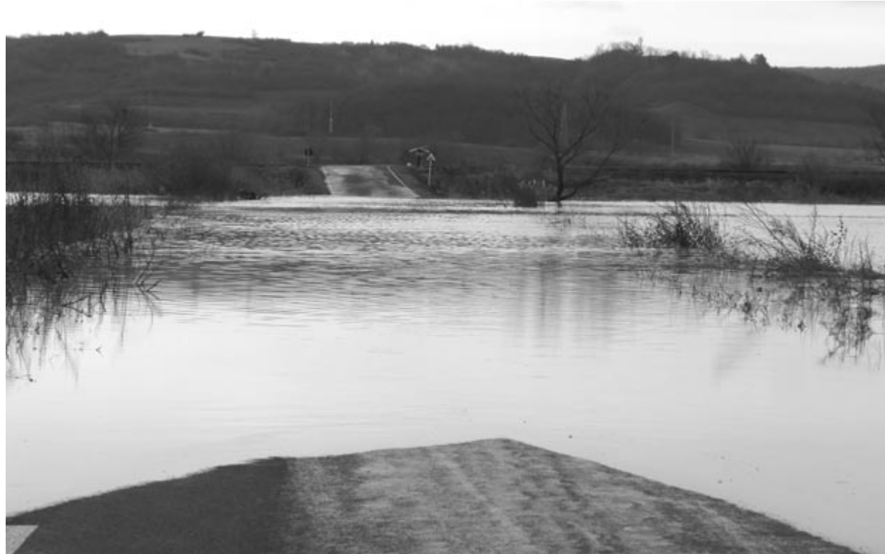
Havadtónél a Kis-Küküllő és a vadasdi patak vize öntötte el a területeket, egy ideig a ravai úton is akadályozta a forgalmat