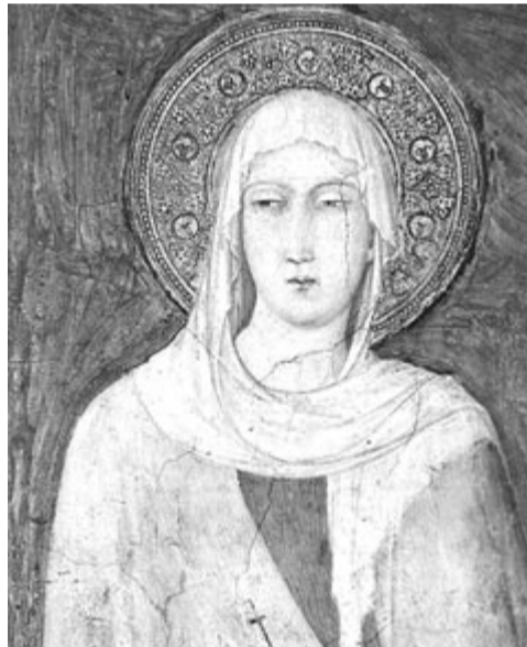
Simone Martini 14. századi táblaképe Árpád-házi Szent Margitról az assisi Szent Ferenc-bazilikában

„E szűznek vala nagy kívánatja, szerelme böjtölésre és nagy szerelemmel majdnem ő erejének felette a szerzetnek regula szerint való keménységét, szenvedettségét, böjtiét, erőlködik vala megtartani. Kinek okáért gyakorta jut vala ő testének nagy fogyatkozására.”