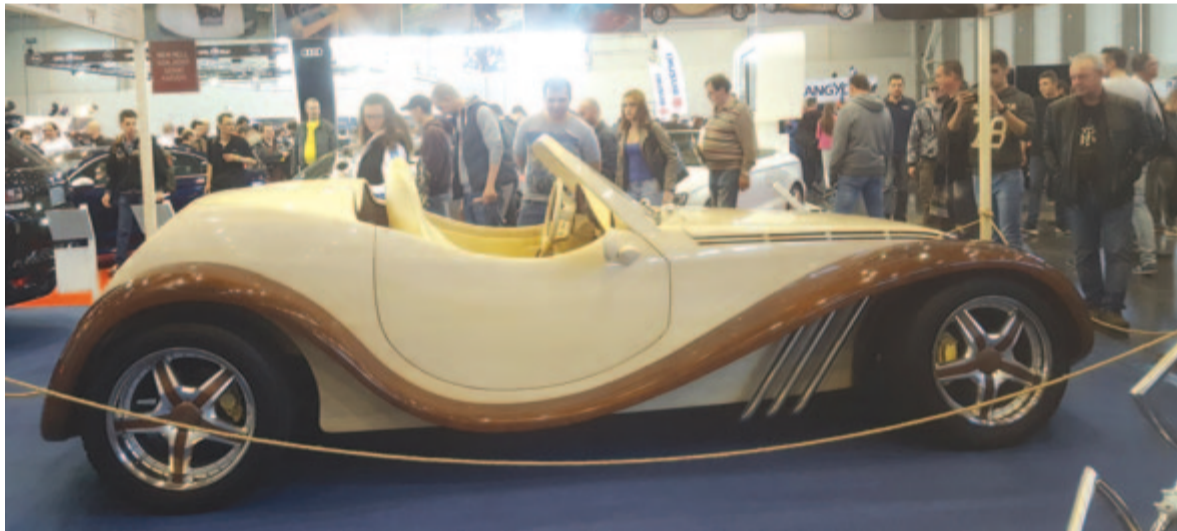
A Frankfurti Autószalonon a faautó csodájára jártak

– A gyermekeknek azt üzenem, hogy semmilyen építő elképzelésről, aminek az ötlete a fejükben megszületik, nem szabad lemondani, tovább kell vinni, mert a sikert lemondással soha nem lehet elérni. Másrészt hinni kell, hogy bármit (például a tehetséget), amit kap az ember, az Istentől jön, és Istennek kell hálát adni mindazért, amit kapunk. A szülőknél, nagyszülőknél pedig azt üzenem, hogy szeressék a gyermeküket, unokájukat.