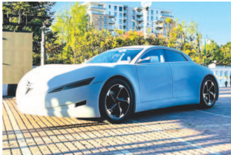
A saját tervezésű elektromos autó

– Miután lerajzoltam, készítettem egy makettet hússzoros kicsinyítésben, és 95 százalékban annak megfelelő lett az eredmény, csak pár kis változás van az eredeti elképzeléshez képest.