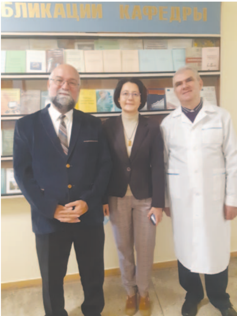
A szerző és vendéglátó

Augusztus 15-én az egykori telep lengyel közösség mai leszármazottai – akár Kacsikán élnek, akár eltelepedtek már onnan az anyaországukba, esetleg máshova –, ma is megtöltik a templomot a lengyel nyelven celebrált szentmisén, miközben a szabadtéri román nyelvű esti, hajnali és főleg déli szolgálatokon tízezernél is több moldvai római katolikus hívő vesz részt. Beleértve a Somoskáról, Pusztináról és máshonnan érkező moldvai csángó magyarokat, akik számára ma már megengedett a magyar nyelvű szentmise megtartása.