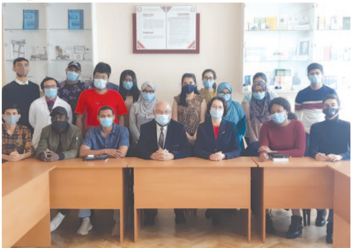
Az orvostanhallgatók körében

A fehéroroszországi lengyelek elcsángósodása egy újabb példa arra nézve, hogy méltatlan és nagy kár, ha veszélybe kerül a kisebbségi lét. Miközben a moldvai és a fehéroroszországi római katolikus templomok ma is büszkén hirdetik az ígét: „A keresztségben ugyanis eltemetkezünk vele együtt a halálba, hogy miként Krisztus az Atya dicsősége által feltámadt a halálból, úgy mi is az élet újdonságában járjunk.”