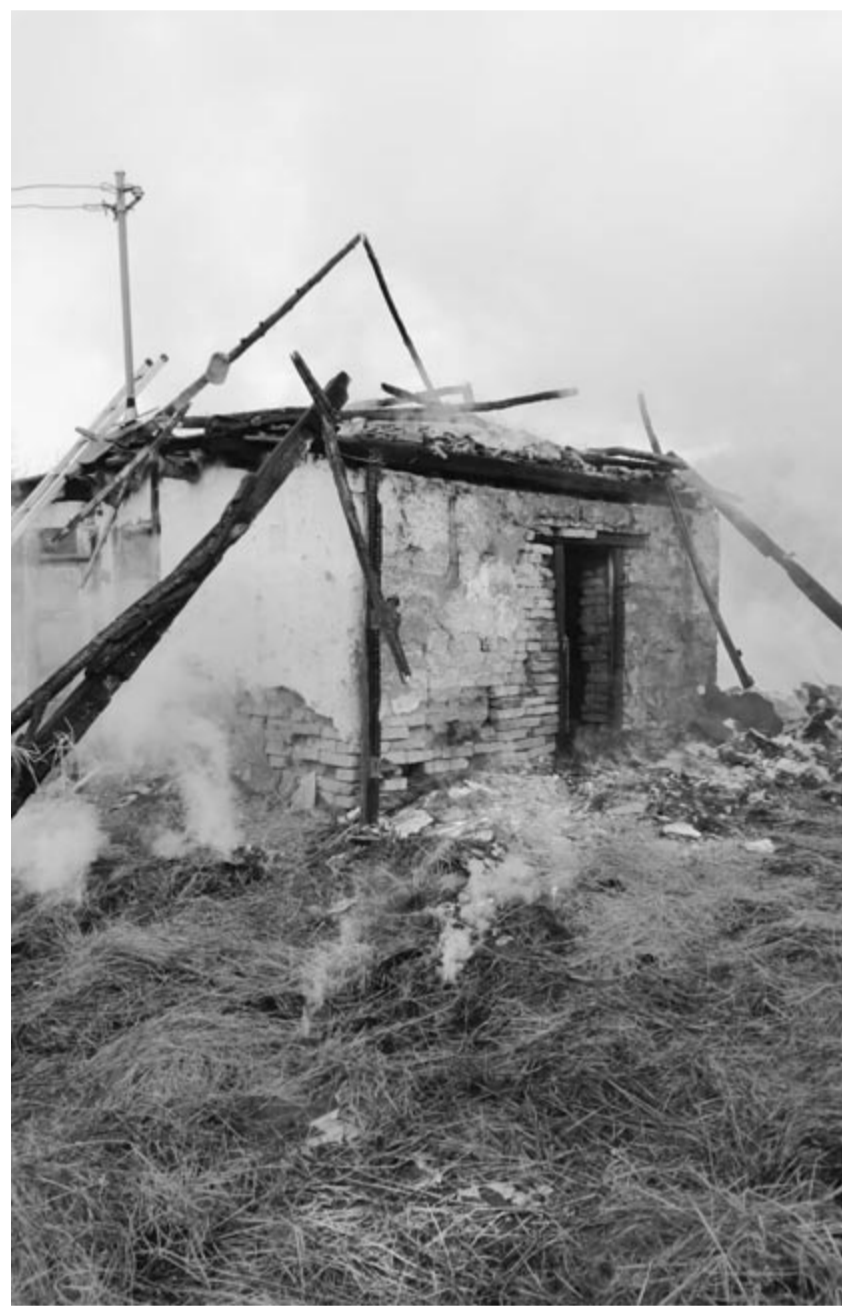
Közel két órába telt a tűz eloltása

A megyei katasztrófavédelmi felügyelőség közleménye szerint a tűz mintegy negyven négyzetméteren borított el mindent, a tragédiát túlélő nagyobbik gyerek másod- és harmadfokú égési sérüléseket szenvedett testfelülete mintegy egyharmadán, őt a rohammentősök helikopterrel szállították a marosvásárhelyi sügősségi kórházba. (grl)