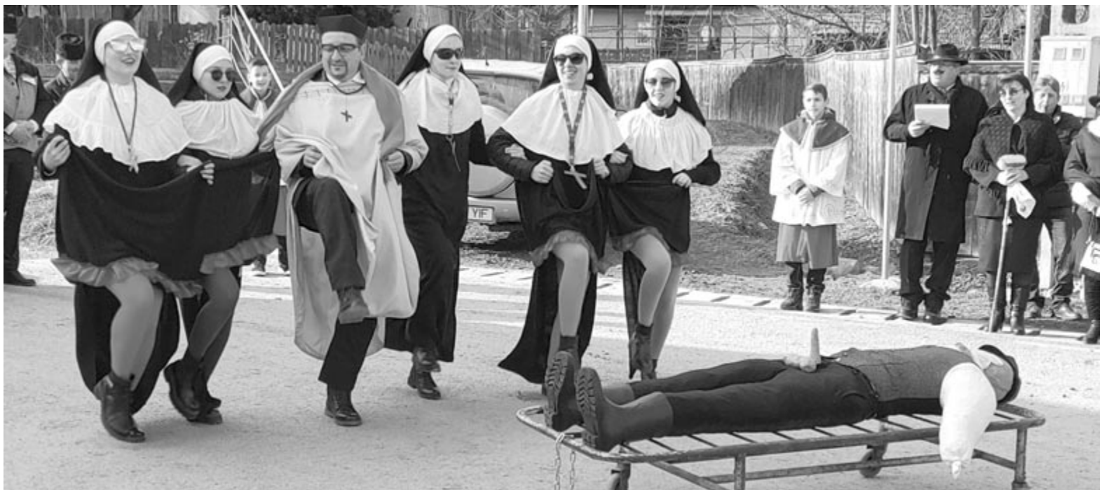
Nyárádselyében új hagyományt teremtenének, a farsangtemetést, Illyés elégetését

Ezt követően az intézmény nagyertermében került sor Barabás László két könyvének bemutatására: Az Összenéztünk, értettük egymást című kötet éppen a Bálint Zsigmonddal eltöltött több évtizedes vidéki kutató- és dokumentációs munkájába és a sóvidéki szokásokba enged bepillantani, míg a Szikonyország eltűnőben? című