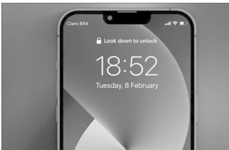
Nézz le a feloldáshoz!

A harmadik újdonság a jelszót védett wifihálózat támogatása a HomePodon. Miután az Apple elkaszálta a HomePod termékvonalat, az egyetlen terméke az okoshangszóró-piacon a HomePod Mini maradt. Ez pedig az utóbbi időben egyre komolyabban az érdeklődés középpontjába került. Bár vannak pletykák azzal kapcsolatban, hogy kaphat utódot a típus, ez még korántsem biztos. Az Apple-nek nem sikerült megtalálni a helyét az okoshangszórók egyre bővülő piacán. A Google és az Amazon pedig komoly előnyt tudhat magának. Természetesen könnyen meglehet, hogy az Apple nem nyugszik bele a jelenlegi helyzetbe. Erre abból is lehet következtetni, hogy az IOS 15.4 béta verziója tartalmaz olyan újdonságokat is, amelyek a HomePodokat érintik. A kódból bizonyosságot nyert, hogy az almás vállalat lehetővé fogja tenni, hogy a hangszórói csatlakoznak a jelszóval védett wifihálózatokra. Ezek általában hotelekben, kollégiumokban és irodaházakban találhatóak meg. A külön weboldalon való bejelentkezést pedig valószínűleg a telefonunkon keresztül fogjuk tudni elvégezni. Ez a híresztelés természetesen nem biztos – ellentétben az első kettővel –, de mint egy egyszerű kényelmi funkció, reménykedhetünk abban, hogy mégis megtörténik.