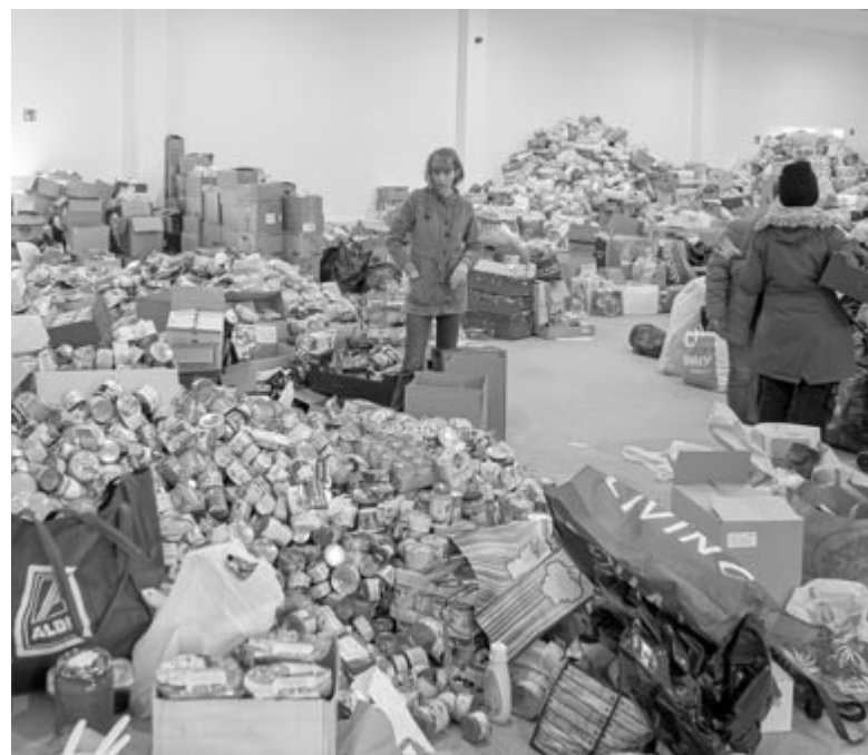
Alapvető élelmiszerek és egyéb adományok ideiglenes raktára Tiszabecsén

Moldovában az ukrán menekültek befogadására ez idáig Ausztria, Franciaország és Hollandia ajánlott fel sürgősségi támogatást, egyebek