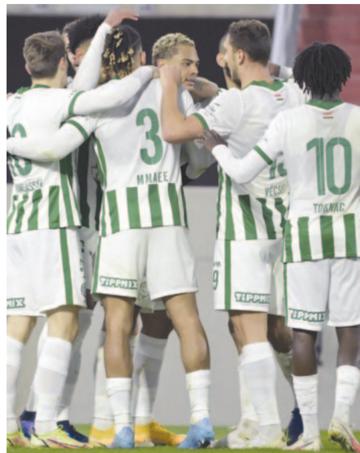
Ferencvárosi játékosok a labdarúgó MOL Magyar Kupa nyolcadöntőjében játszott Vasas FC – Ferencvárosi TC mérkőzésen szerzett második góljuk után, az Illovszky Rudolf Stadionban 2022. február 9-én. A Ferencváros 2-0-ra győzött

A negyeddöntő programja ma délután az NB III keleti csoportjában kilencpontos előnnyel listavezető Kazincbarcika, valamint az OTP Bank Ligában 22 forduló alatt 56 gólt szerzett Paks mérkőzésével kezdődik. A címvédő Újpest FC szerdán a másodosztályú Békéscsaba vendége lesz, majd csütörtökön a MOL Fehérvár FC az ugyancsak NB II-es ETO FC Győr otthonába látogat. A jelenleg versenyben lévő nyolc csapat közül a székesfehérvári az egyetlen, amely