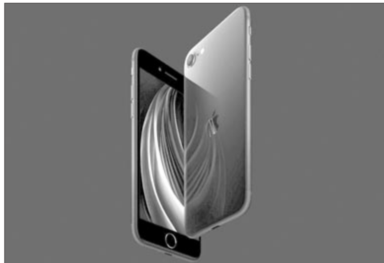
iPhone SE+ 5G

Az egyik ilyen a Tap to Pay funkció. Az Apple Payt már rég ismerjük, és már Romániában is nagy hagyománynak örvend. Sokan fizetnek az iPhone-nal vagy Apple Watchsal. A szoftver megjelenésével pedig már nemcsak fizetni lehet