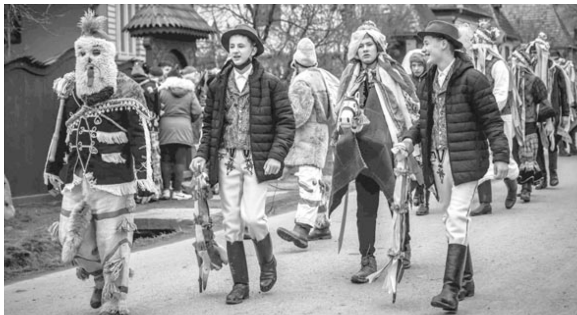
Kibédén a hétvégén is sor került a farsangi lakodalmas játékra, ott voltak a „szépek” és a „csúfak”

Vasárnap délután Nyárádselye is szórakozott: a falu piacán nem mindennapi tömeg gyűlt össze, a szomszédos falvakból és távolabbról is érkeztek vendégek. A helyi fiatalok második alkalommal szerveztek farsangtemetési játékot, és nemcsak