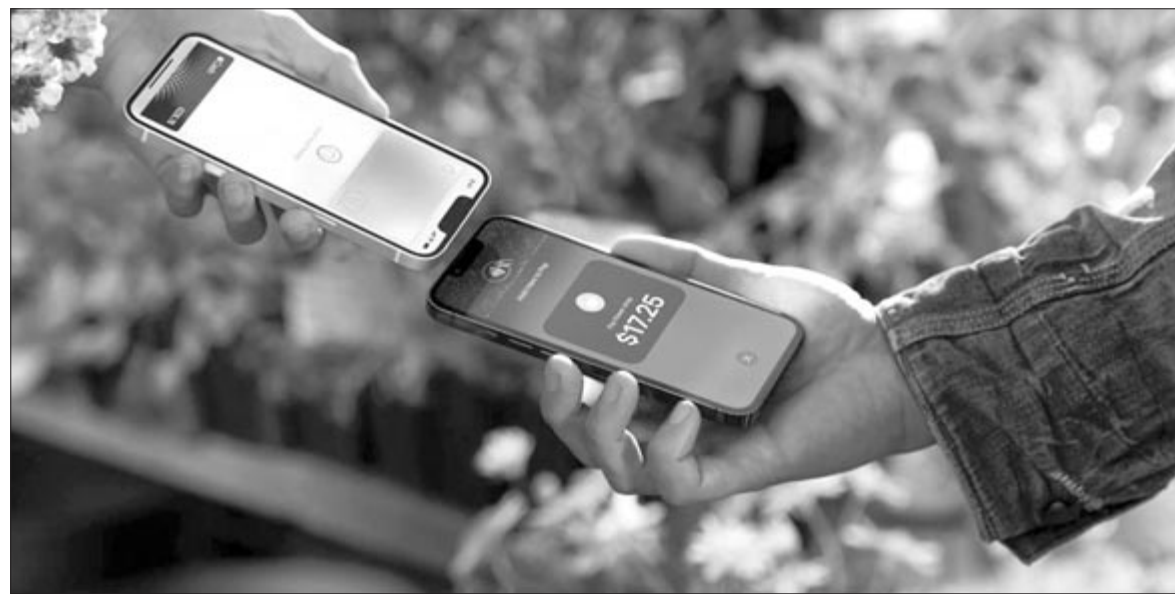
Tap to Pay

Voltak még régebbi pletykák azzal kapcsolatban, hogy az SE teljesen megújul, megkapja az Apple FaceID-jét teljes képernyős kialakítással, és lényegében átveszi az idén már megszűnő Mini modell helyét – idéntől ugyanis az alapmodellből nem Mini, hanem Max változat fog készülni. Azonban, akik ezt várták, azoknak még legalább 2023-ig nem tudunk biztosan jó hírrrel szolgálni. Lehet, hogy 2024-ig is várhatnak, feltehetően valamikor akkor fog egy jelentősebb átalakuláson átesni az SE. Ez állítólag már egy vékonyított kávát 5,4 hüvelykes képátlójú készülék lesz, és itt már az