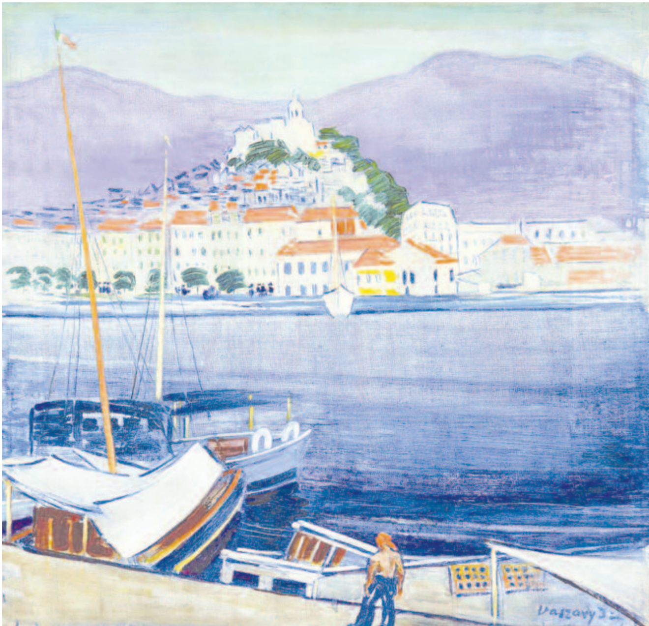
Vaszary János: San Remo

Boromisza Tibor Zazar-part című műve, amely egyesíti a nagybányai korszak különféle műcsoportjait, indulóárának több mint kétszereséért, 16 millió forintért cserélt gazdát.