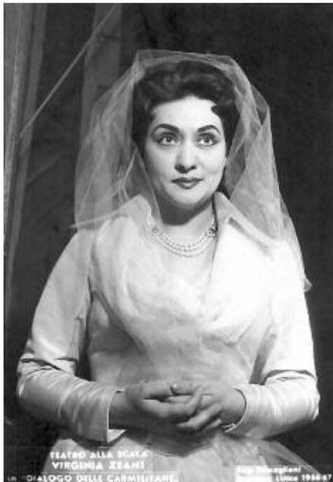
(Folytatás a 3. oldalról)