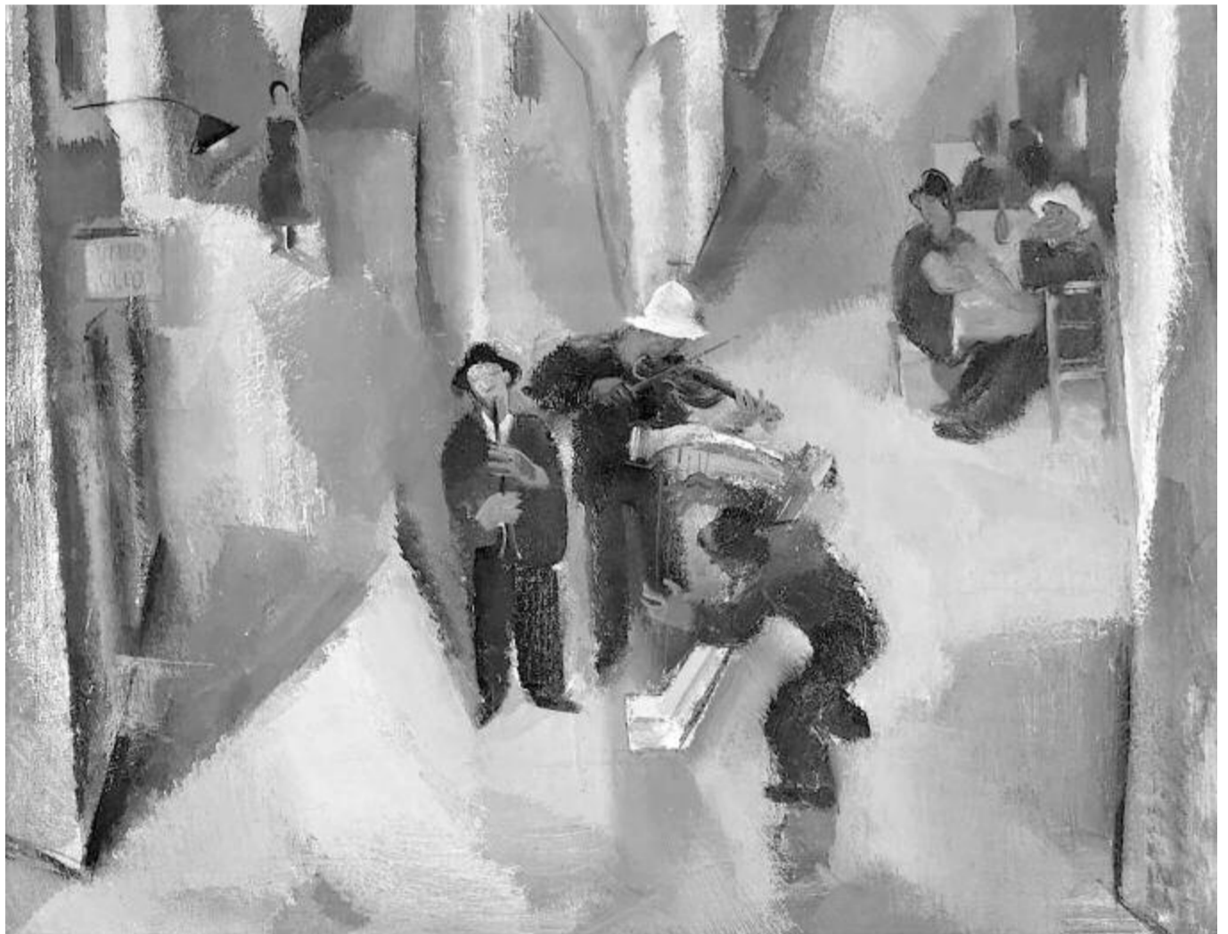
Aba Novák Vilmos: Utcai zenészek (részlet)

1883. október 22-én, 138 éve hunyt el a Költő.