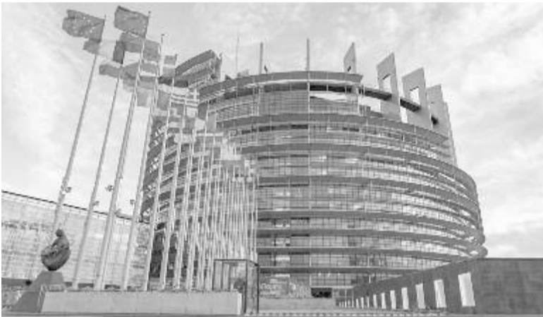
Az EP strasbourgi székhelye