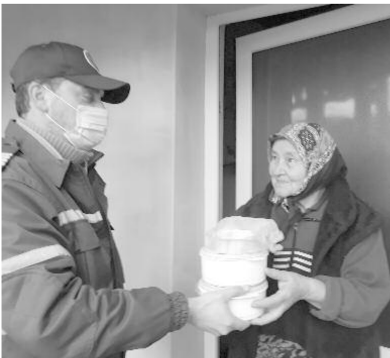
Sok helyen nagy segítség akár heti egy alkalommal is egy meleg ebéd