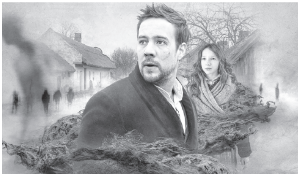
Jelenet a filmből

Az Oscar-nevezés meglepetésként érte, mert nem számított rá, de megjegyezte: különösen azért örül ennek, mert éppen egy közönségfilmet küld az ország a legjobb nemzetközi film kategória mezonyébe.