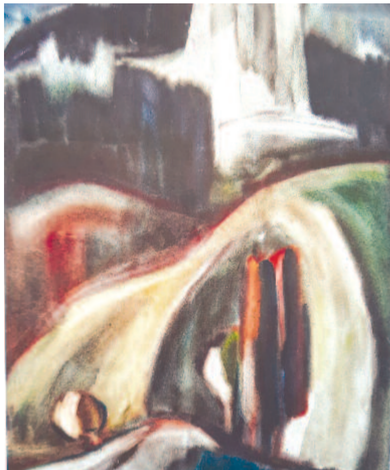
Márton Árpád: A természet oltára (akvarell, 1966)