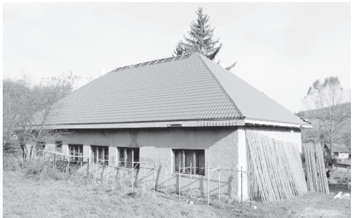
A kultúrothon tetőzete mindenhol beázott – nemrég elkezdődött az épület teljes felújítása