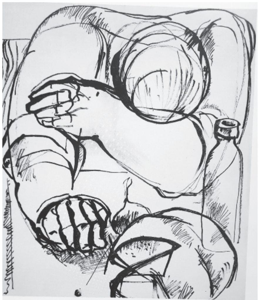
Pihenő... Márton Árpád tusrája

*85 éve, 1936. november 3-án hunyt el a költő