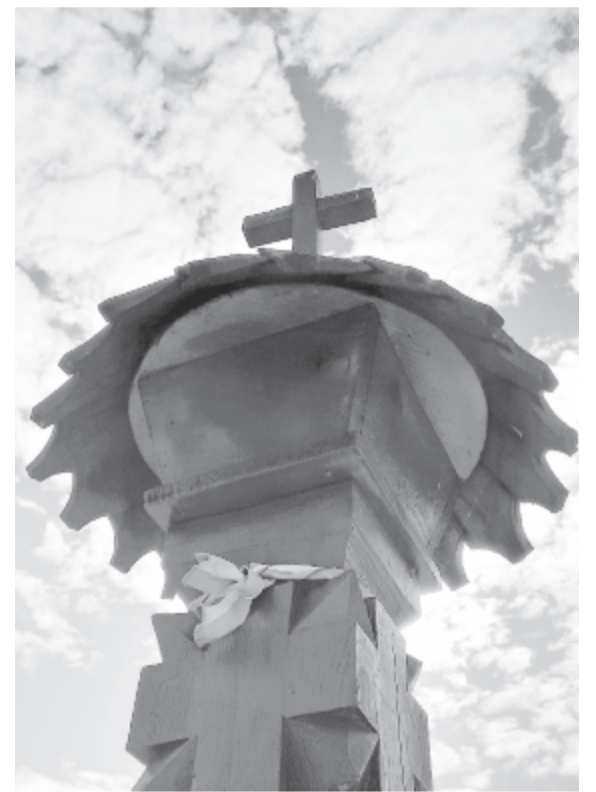
Gyimesbükkői égbolt alatt