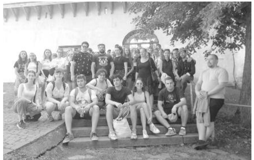
Idén két martonvásári csoport negyvenegy táncosa érkezett Maros megyébe

„Szép esemény volt, ami sok fáradozást igényelt, de annál több szellemi és kulturális feltöltődést nyújtott” – értékelte a rendezvényt a lelkész, kiemelve, hogy számos kölpényi család is bekapcsolódott a szervezésbe, vendégszeretettel vállalva az anyaországi elszállásolását is. A következő táborot remélhetőleg jövőben Martonvásáron tarthatják meg. Az egyháznak elsőrendű feladata a hívek pástorálása, de a martonvásári kapcsolat is az egyházközösség támogatásával létezik, a hívek is kiveszik ebből a részüket – mutatott rá a lelkész.