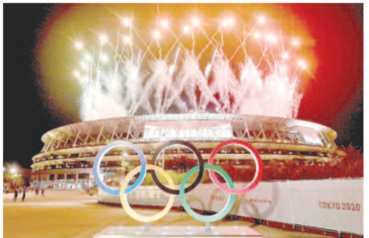
Tűzijáték a 2020-as tokiói nyári olimpia záróünnepségen az Olimpiai Stadionban

Tokió augusztus 24. és szeptember 5. között a paralimpikonokat látja vendégül. (MTI)