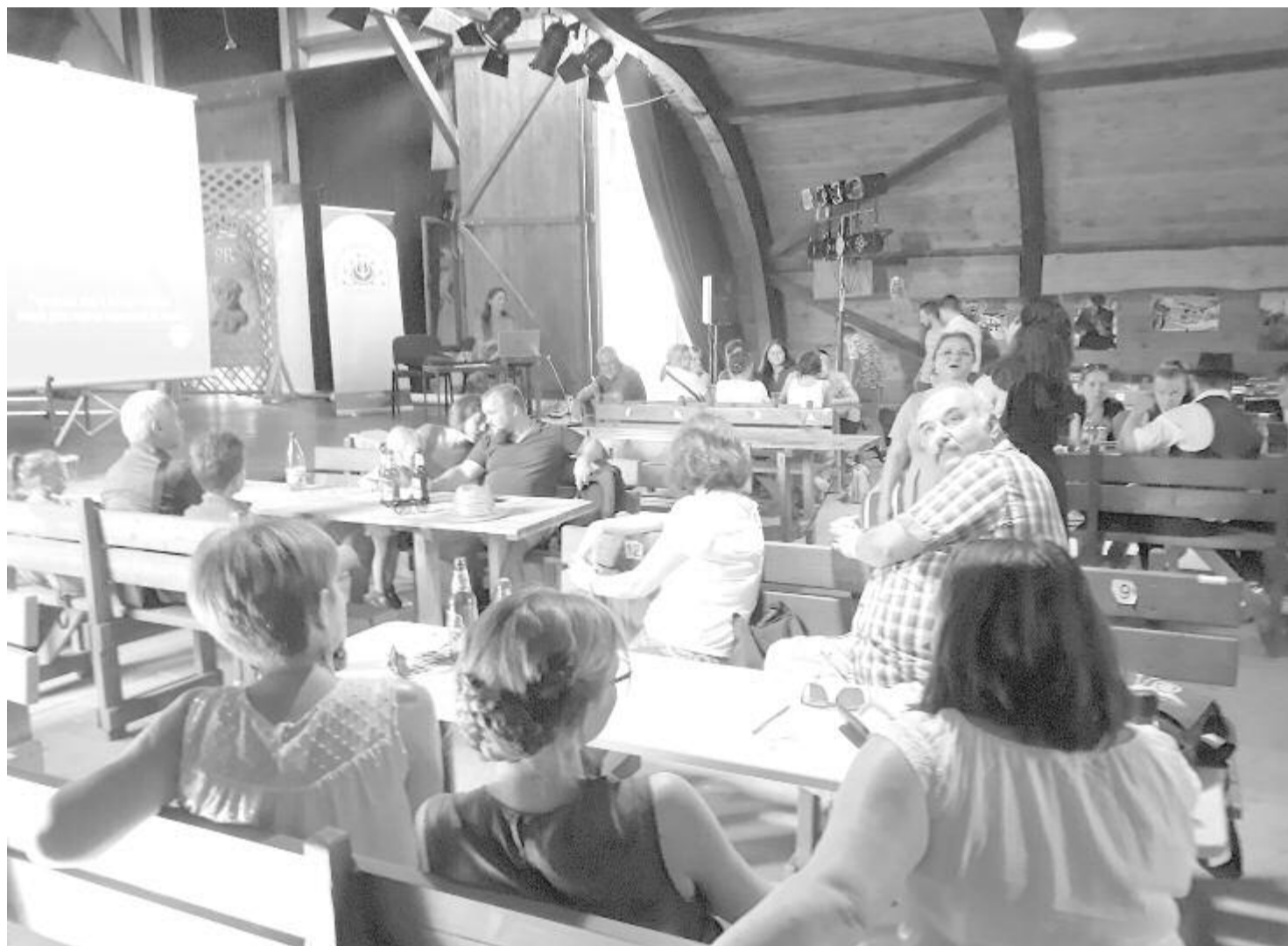
Egyre népszerűbb szakmai játék a folkocsmakviz – számos új, érdekes elem is megjelent a mikházi szabadegyetemen

Az esemény kiemelkedő pontja, hogy 20 éves a HH, és hogy az utolsó táncháztalálkozó óta megalakult az Erdélyi Hagyományok Háza Alapítvány is. A szombat esti gála vendége lesz a budapesti Magyar Állami Népi Együttes, amely idén 70 éves, és amely előző nap, szeptember 10-én Marosvásárhelyen is bemutatja műsorát – részletezte a székelyudvarhelyi rendezvény szervezője.