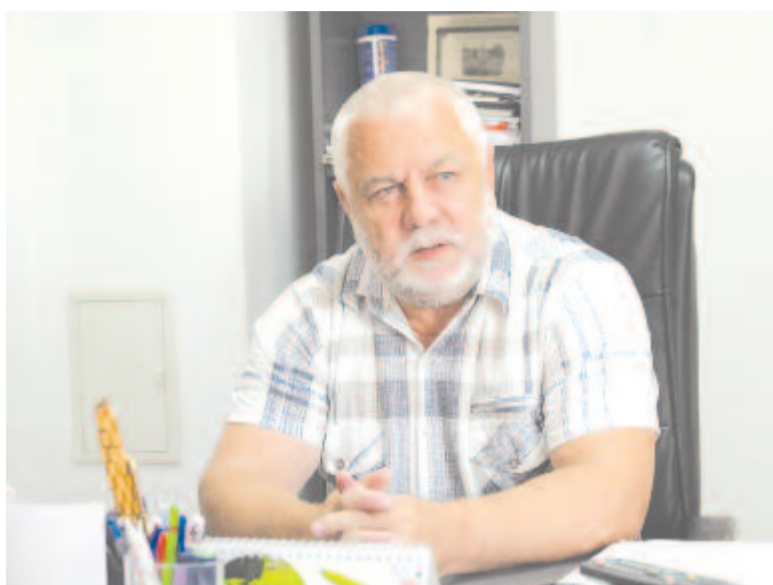
Karácsony Károly polgármester

A nyárádgálfalvi iskola épületének a tetőzetét teljesen újjáépítették, egy új szárnnyal toldották meg az épületet, a falak külső szigetelésén is dolgoznak. A kibővített épületrészben kazánház, raktárhelyiségek, illemhelyek, gyűlés- és kiállítóterem lesz, az emeleten informatika és fizika-kémia szaktanterem. Az iskolát korszerű tanintézményként szeretnék majd átadni. Amint elkészült, a diákokat visszaköltöztetik, a szentháromsági iskola emeleti részét lezárják, az épületben csak az elemi osztályok és óvodások tanulnak majd. A szentháromsági általános iskola műfüves sportpályáját két éve adták át. A Leader-program révén megvalósított projekt kb. 60.000 euróba került – tájékoztatott Karácsony Károly, Nyárádgálfalva polgármestere.