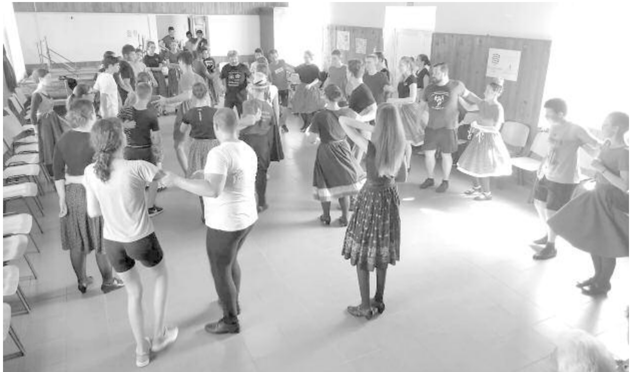
Múlt héten felcsíki és mezőkeszűi táncokat tanultak a táborban