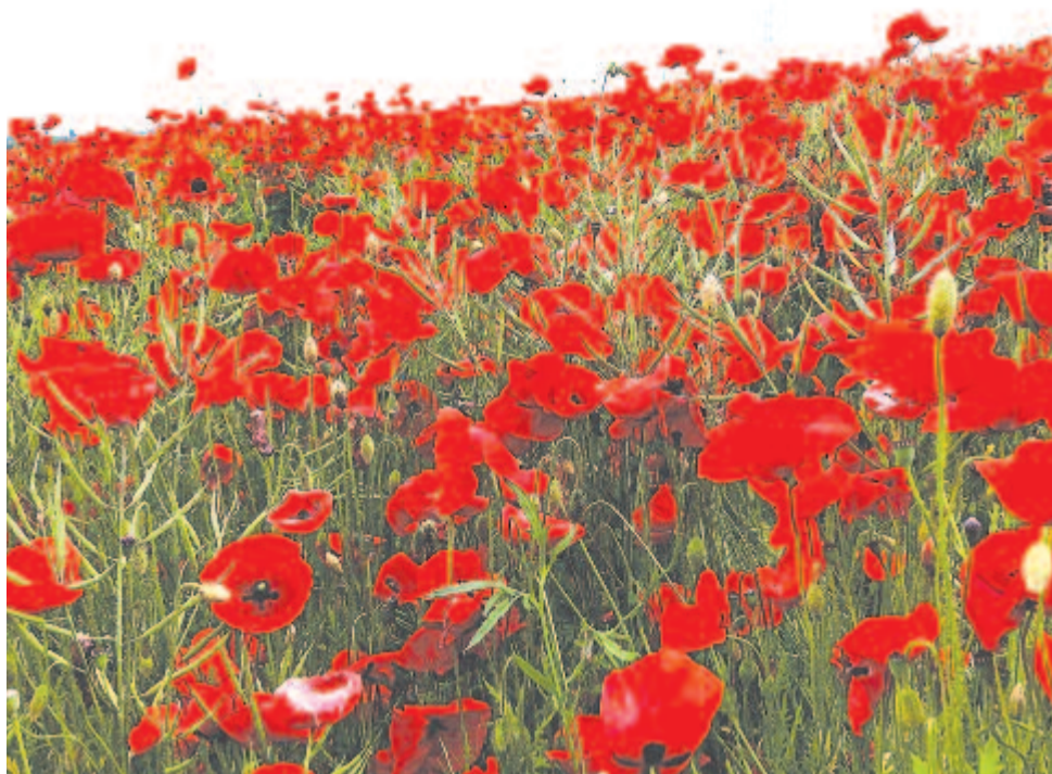
Nagy vércsöppekben hull a pipacs

Három fertály évszázada, 1946. július 25-én vajon hogyan fogadta a vizek ura, hogy már immár az ő birodalmát is atombomba-robbantással zavarja meg a tudálékos ember? Mintha nem lett volna elég Hiroshima és Nagaszaki tragédiája, az USA e nap kezdte el víz alatti kísérleti atombomba-robbantásait a Bikini-szigeteken.