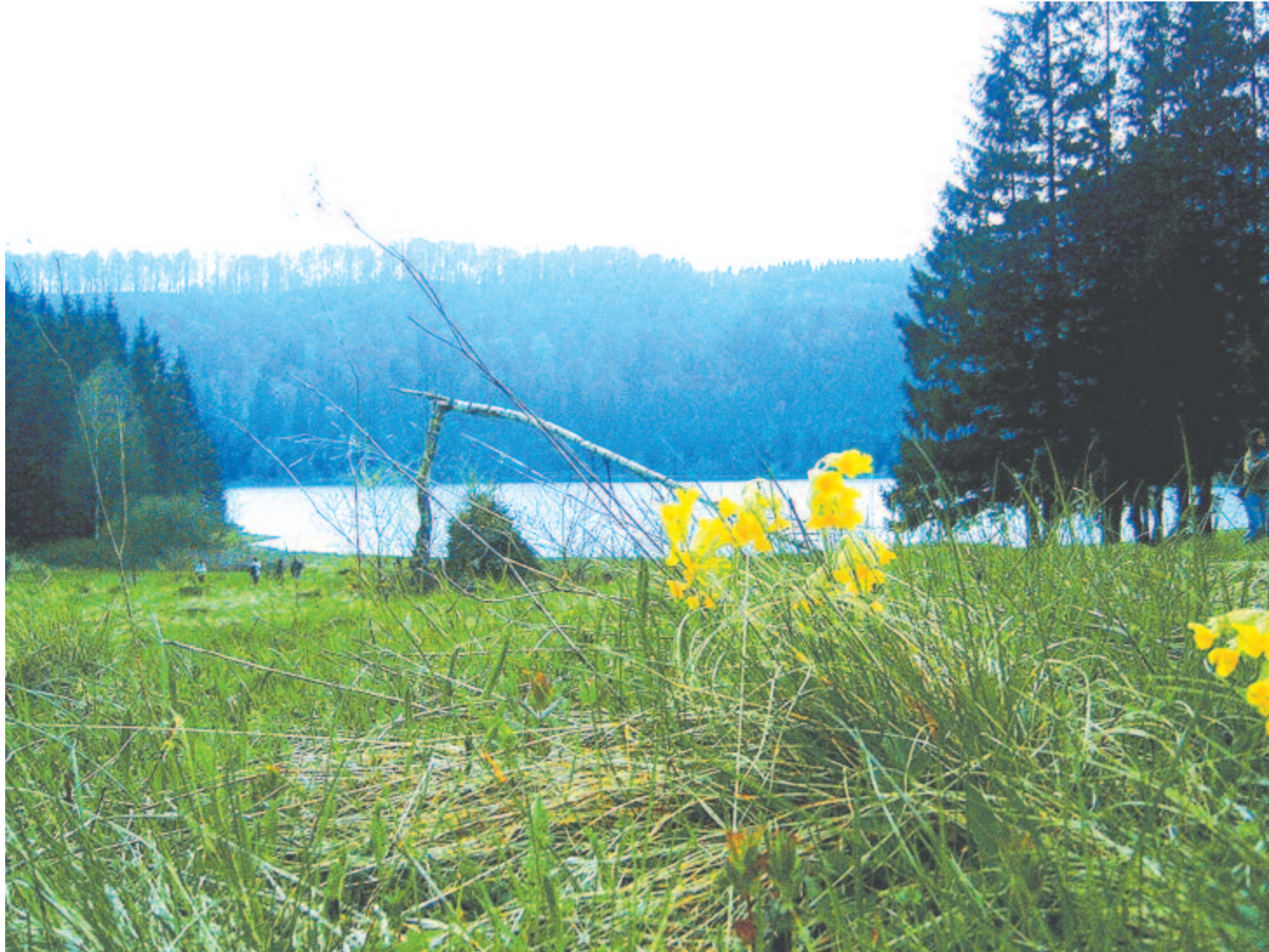
A roppant fenyők sötét rámába fogják az ércvilágú vízlapot

Kelt 2021-ben, a Perseidák csillaghullásának kezdetén