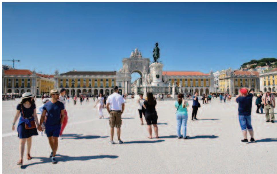
A Comercio tér

párat említsek –, olyan változatosak a tájegységei. Mint utólag kiderült, kevés helyen jártam, mely egy aránylag kis területen ilyen nagy változatosságot mutat. Igaz, nincsenek látványosan magas hegyei, de a 4-500 m-es dombjai úgy be vannak építve, hogy ember legyen a talpán, aki különösebb megerőltetés nélkül bejárja óvárosai keskeny, kacskaringós, emelkedő utcáit, útvesztőit. Ennek ellenére vonzóak, tiszták, piros cserepes fehér falaik messziről csábítják a látogatókat. Nem tudom, hogy helyszűke miatt, vagy stratégiai megfontolásból alkalmazták ezt a megoldást, de egyéni, szép, különleges. Bátor, aki nem ismeri, és ide merészkedik autót vezetni, még jó GPS-szel is. Még az ország déli részén is, mely síkságon van, találtak egy-egy dombot, hogy városaikat, minden mai érv ellenére, oda építsék. Ha pedig nem várat építettek a dombokra, akkor teraszosították, és csodákat műveltek a bortermelés terén, mint például a Douro völgyében. Nehéz volna eldönteni, melyik szebb, látványosabb vagy hatékonyabb: a Douro vagy a Rajna völgye?