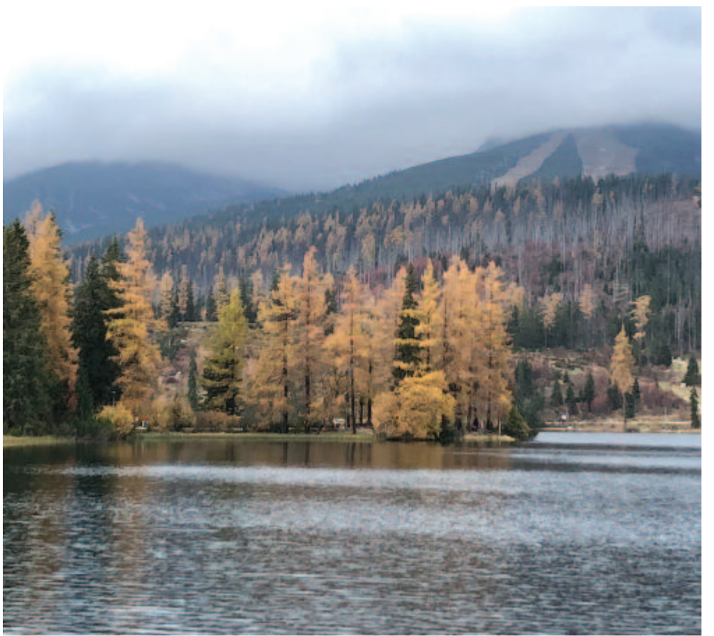
Lezúdul a szél a hegyekből

E lombtalan bátorság ígézetében élek most. Az utolsó beérett füget szedem a fáról iskolám udvarán, Szentendrén. Füget, „amelyről a tudós emberek mondják, hogy virágját sohasem hullatja el, hanem – mint a reménység magzatát – körülövi azt a gyümölcsével – veszem kölcsön a szót Sütő Andrástól . A Nagyeneydi fügevirág példája '45 után a vásárhelyi Ranghet Iosif középiskolában – mindközönségesen a Református Kollégium jogutódjában, a Bolyai Farkas Líceumban – is tovább élt, ahol, bár a füge szabadban nemigen terem, s a tél fagyja megöli puha fáját is, az iskolaudvar bal hátsó sarkában, az üvegházban beérő gyümölcsei tovább éltek a reményt. (Mert a középiskola első éveit Enyedden kezdő, s az 1940-es tanévet már Vásárhelyen folytató diákja mint a retorziók elől menekülő magyarózdai református kántortanító fia – édesapám – már az iskola biológiatanáráként ültette, nevelte a remény fügefáját.)