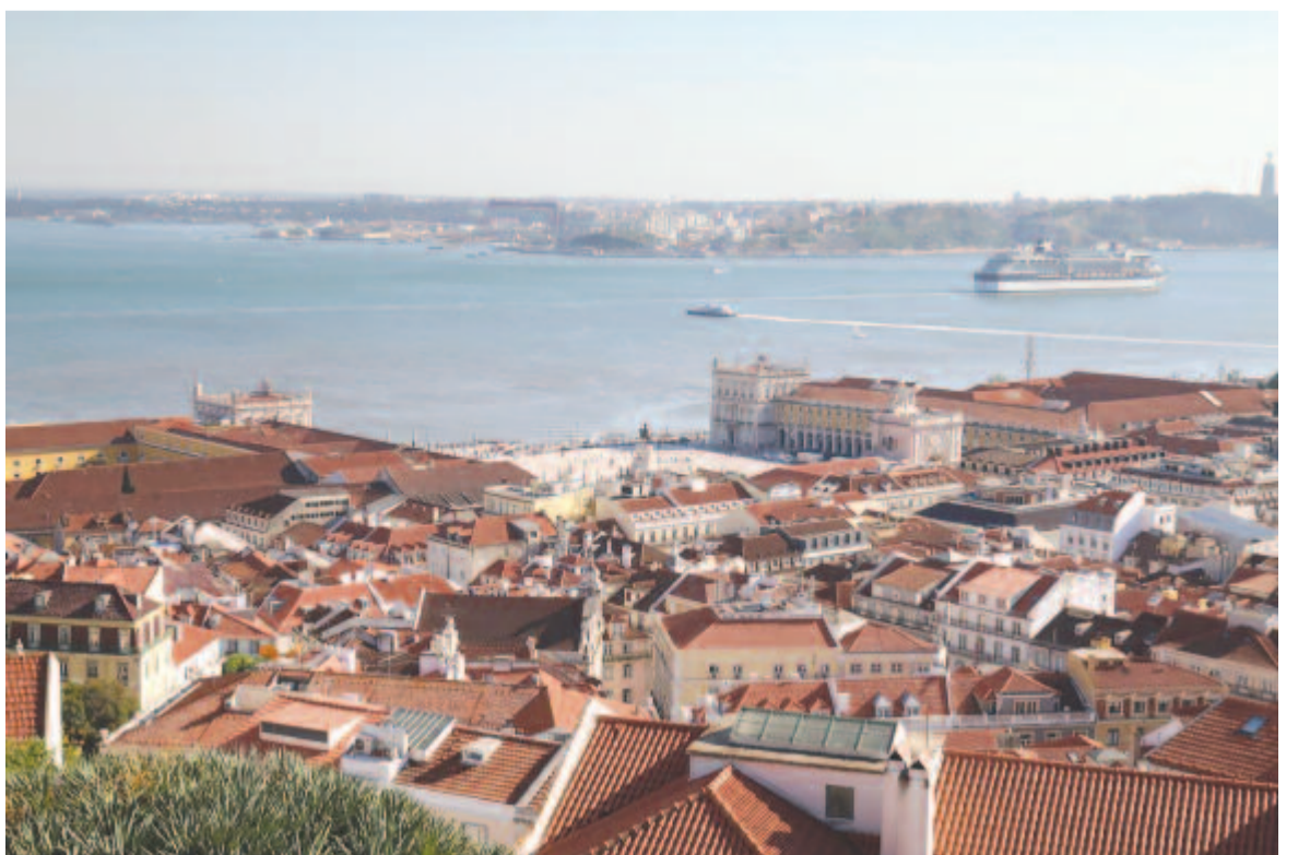
És a kilátás, távolban a Tejo partján a Comercio tér

Jó két hetet töltöttünk ott, többnyire bejártuk fontosabb részeit, de csak kellemes meglepetésekben volt részünk. Tiszta, rendezett, lakói segítőkészek, barátságosak. Több mint 2.000 km-t tettünk meg, de csupán egy közúti rendőrrel találkoztunk. Ellentétben Spanyolországgal, ahova átugrottunk két napra, és ezalatt legalább nyolc rendőrkocsival találkoztunk.