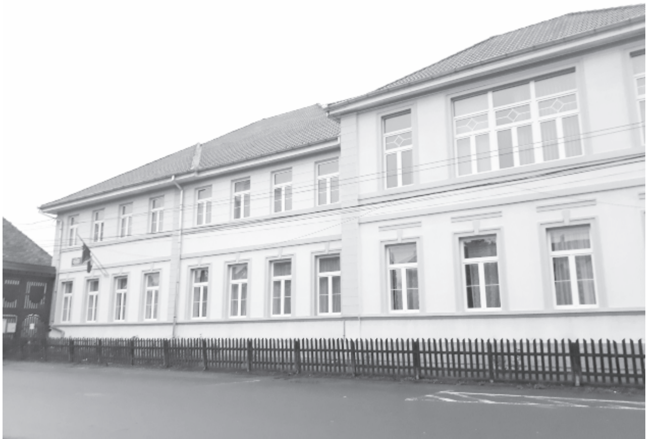
Csak két nap szünetelt az oktatás a Bocskai István középiskolában