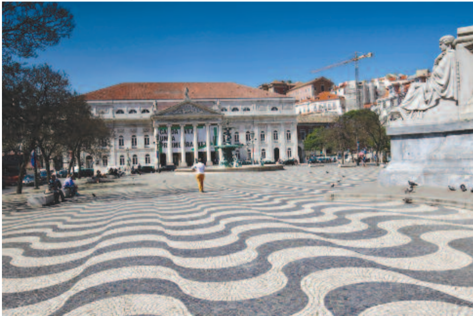
A lisszaboni Dom Pedro tér és a nemzeti színház

Már régen kacérkodom a gondolattal, hogy meglátogatjuk Portugáliát, de valami mindig közbejött, lehet azonban, csak az volt a baj, hogy nem tulajdonítottam neki megfelelő jelentőséget. Pedig megérdemelte volna, hiszen az olyan kicsi ország, mint Magyarország, valamikor megelőzte az angolokat a világ felfedezésében, illetve gyarmatosításában. És ha II. János portugál király nem utasítja vissza Columbus szponzorálását az Indiába vezető út megtalálásában, nehéz elképzelni, mekkora hatalomra tettek volna szert. A történelem során nyomot hagytak Brazíliától Nagasakiig, Barbadostól Srí Lankáig, a Zöldfoktól Kelet-Timorig.