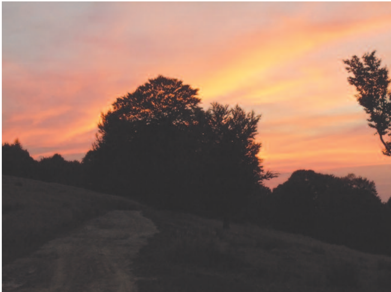
Az októberi alkony fénye

Kelt 2020-ban, október 2-án, az erőszakmentesség világnapján