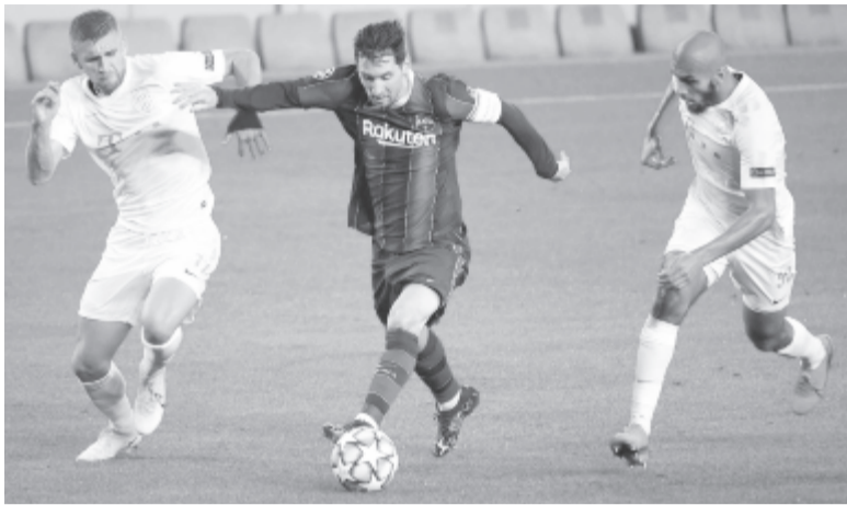
Nemigen tudták megállítani Leo Messit a Ferencváros játékosai az első Bajnokok Ligája-csoportmeccsen. A Dinamo Kijev ellen az Úllői úton javíthatnak

Fontos feladat a teljes reklámentesítés is, hiszen az Európai Labdarúgó-szövetség (UEFA) számára a BL a legfelfeltettebb termék, és még egy több mint tízfős csapatot is