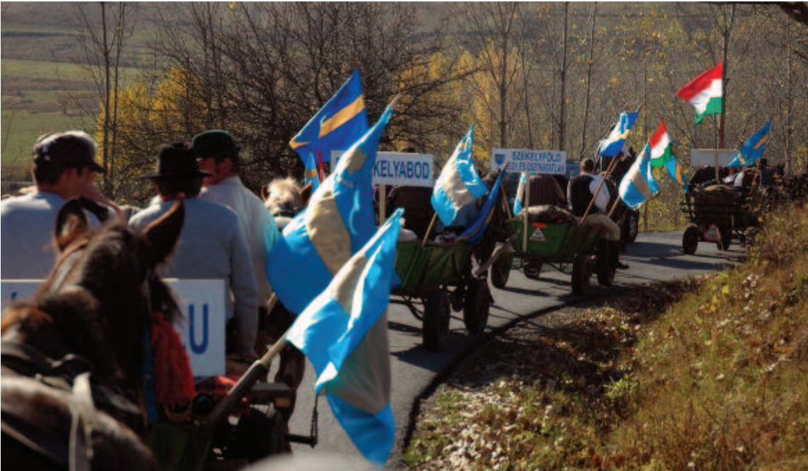
Makfalván a székely karavánra is emlékeztek