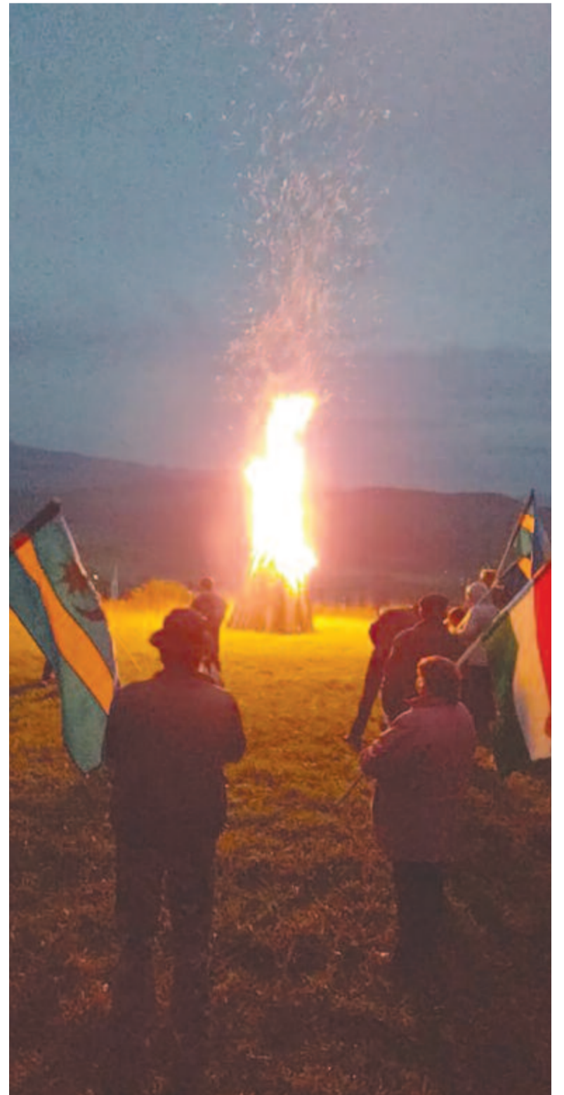
Vasárnap ismét a székely autonómia érdekében gyújtottak tüzet

Székelyföld autonómiájának napjára nemcsak itthon, hanem az anyaországban is figyelmet szenteltek, vasárnap számos kisebb, helyi kezdeményezés mellett szervezett keretek között gyújtottak őrtűzet „a székely testvérekért” Budapesten, Szegeden, Székesfehérváron, Érden, Monoron, Kétpón. (grl)