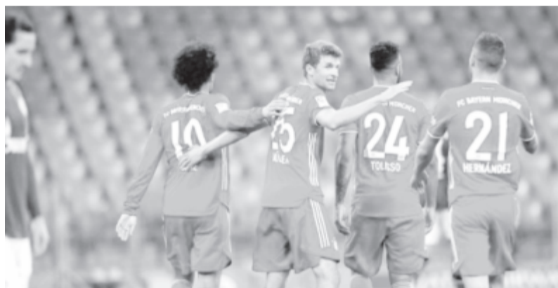
Óriási csapást mért a Bayern a Schalkéra a Bundesliga nyitófordulójában.

* Német Bundesliga, 1. forduló: Bayern München – Schalke 04 8-0, Borussia Dortmund – Mönchengladbach 3-0, RB Leipzig – Mainz 3-1, Wolfsburg – Bayer Leverkusen 0-0, Eintracht Frankfurt – Arminia Bielefeld 1-1, Union Berlin – Augsburg 1-