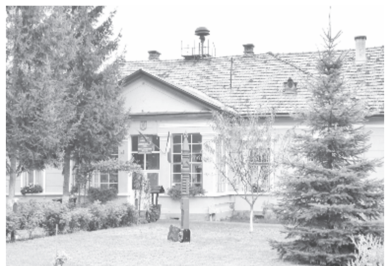
Felújítják a községházát, ha a projekt nyertes lesz – ez az egyik vitatott pályázati tárgy

vatalos közlést is kért a CNI-től, és amint megkapja, nyilvánossá teszi, hogy bebizonyítsa: ellenfele nem mond igazat.