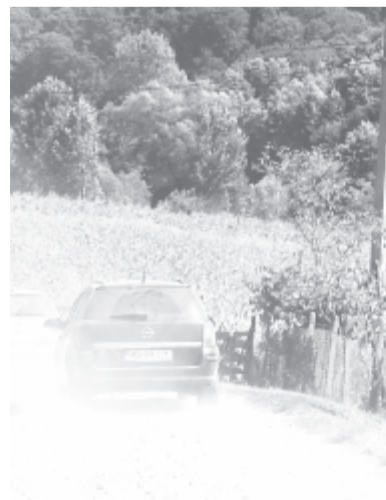
Szolokmába aszfaltút és kultúrotthon is kellene – ha pozitívan bírálják el a CNI-hez benyújtott kérelmeket