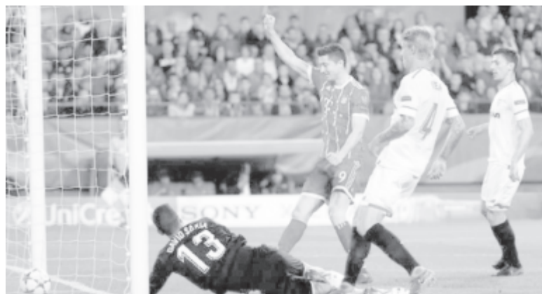
Eddig mindössze egyszer találkozott egymással a Bayern és a Sevilla: a Bajnokok Ligája 2017/2018-as idényének negyeddöntőjében az első felvonásban a Bayern 2-1-re nyert idegenben, míg a müncheni visszavágón gól nélküli döntetlen született

Mindkét együttes „élen jár” az elveszített finálék tekintetében, a Sevilla – a Barcelonához hasonlóan – négy, a Bayern pedig három ilyen összecsapást bukott el.