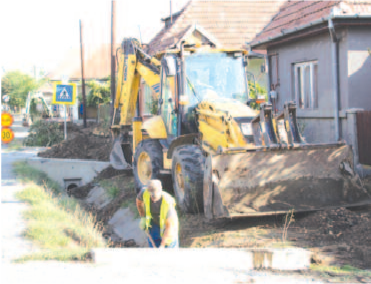
Folyik a vízvezetés Sáromberkén