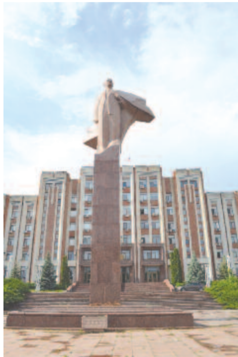
Áló Lenin Tiraszpolban a parlament előtt

A korrupció érezhetően az ajtón kopogtat, miközben gyakrabban találkozunk a „sheriff-fel”, mint az amerikai vadnyugaton. A legismertebb név ugyanis, több helyen cirill és latin betűkkel kiírva: Sheriff. Benzinkutak tulajdonosa, olajbiznisz főszereplője, gyárak működtetője, üzlettulajdonos, pénzváltók és boltok névadója. Sheriff Stadion, FC Sheriff Tiraszpol. A csapatot általában FC Sheriffként nevezik, hogy ne tévesszék össze a városban létező másik csapattal, melynek neve FC Tiraszpol. A legjobb csapat a hivatalos Moldovai Köztársaságban, simán veri a kisinyovi Bölényeket (FC Zimbru), rendszeresen kijut a nemzetközi porondra. A Wikipédia adatai