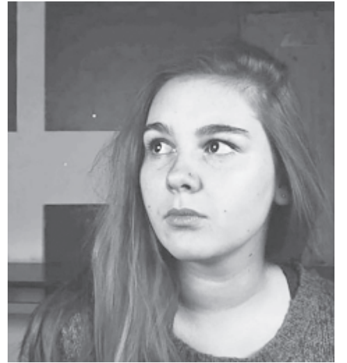
Fotók: Nagy B. Sz.

Véleményem szerint jól meg van oldva, könnyebben lehet Nagyváradon közlekedni, mint Kolozsváron vagy akár Marosvásárhelyen. Nekem nincs jogosítványom, de nagyon sok barátomnak van, és elég sokat közlekedünk autóval. Példaként Kolozsvárt és Vásárhelyt tudom felhozni, mert Kolozsvárra elég sokat járunk, és Marosvásárhelyen éltem 19 évig, az a véleményem, hogy nagyságrenddel jobb a közlekedés Váradon.