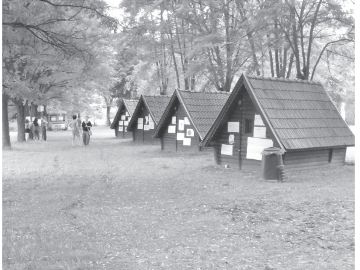
A csendes, kellemes környezetben elmélyedhettek, imádkozhattak a fiatalok, átértékelhették kapcsolataikat

Az ifjúsági tábor után a kölpényi és szabédi gyülekezet gyerekei számára szerveznek hamarosan bibliatáborot, azt követően konfirmálásra kerül sor az egyházközségben, és ha lehetőség lesz rá, megtartják az idősek napját is. „Ha az emberi tervek belesimulnak Isten terveibe” – toldja meg a lelkész, kiemelve, hogy az idei ifjúsági tábor is a svájci testvérgyülekezetnek, Zellnek köszönhető, amely évente igyekszik anyagi támogatást nyújtani a kölpényi egyházközség missziós tevékenységeire.