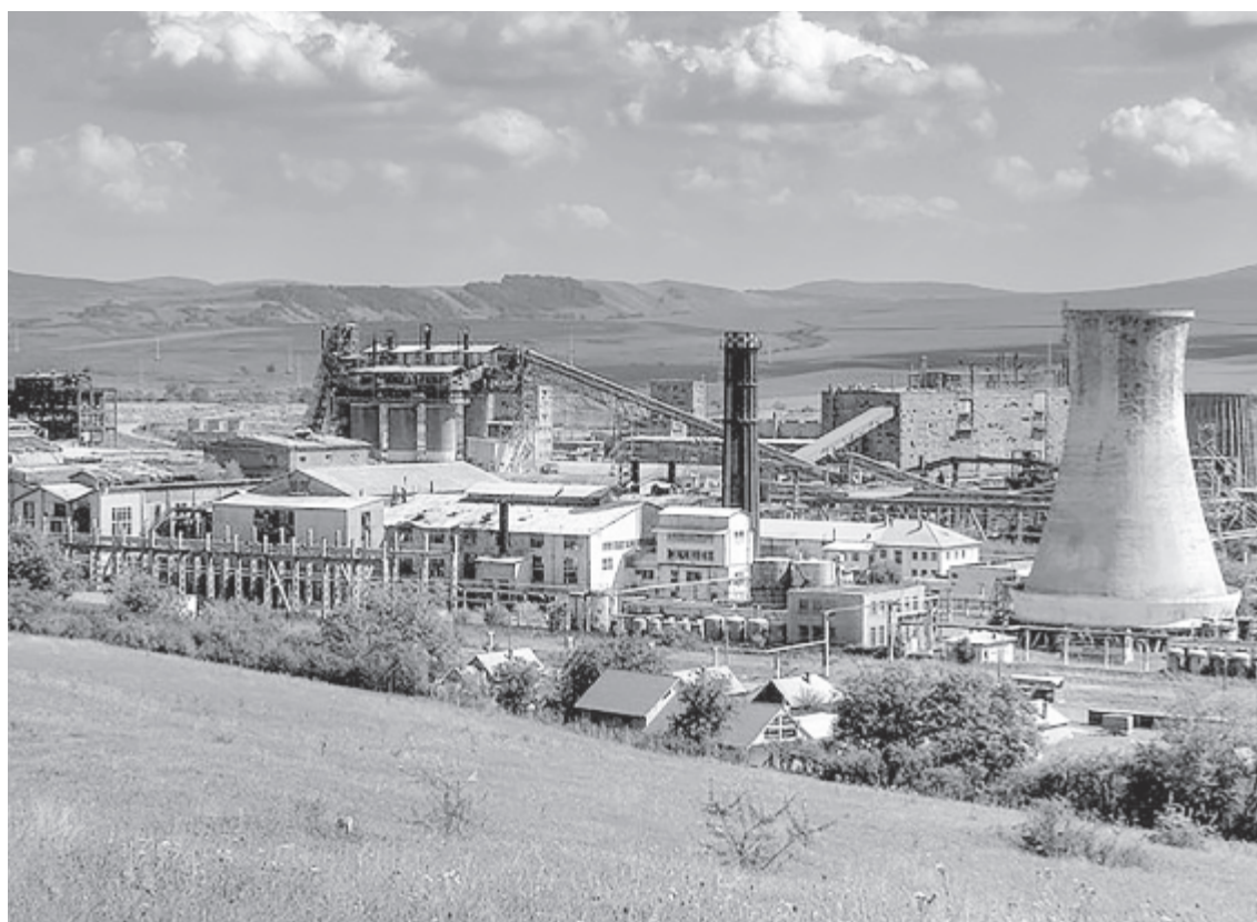
A dicsőszentmártoni kombinát egykoron (illusztráció)