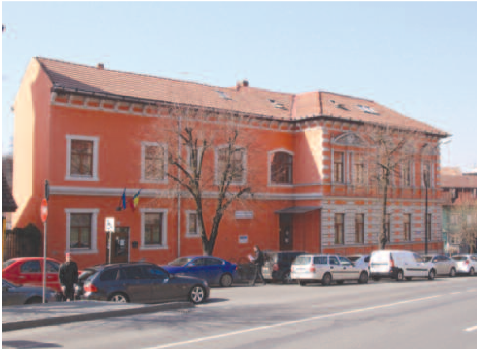
A Maros Megyei Klinikai Kórház adminisztratív épülete