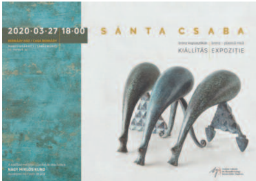
Az elnapolt kiállítás plakátja

Bronznépességről beszéltek, mert a geometrikus és az organikus formák egybefonódnak ugyan ezeken a kispasztikákon, de egyértelmű, hogy emberi alakokkal, fogalmakkal, tulajdonságokkal, jelképekkel van dolgunk. Nőkkel és férfiakkal, kettejük közös dolgaival találkozunk a tárlaton. Nász és gyász, születés és elmúlás, kezdet és vég és mindaz, ami közte van, öröm és bánat, dicsőség és gyarlóság, helytállás és öndicsőítés s még ki tudja mi minden tűnik föl a Sánta-féle pasztikai ötletziporkák kavalkádjában. Ökonómikus, tömönatos megfogalmazásban, ám igen leleményesen, olykor cifrázva is életfás motívumokkal, csigavonalakkal, különleges karcolatokkal, bemélyülő, domborodó díszítőelemekkel. A humort, a groteszket is kellőképpen adagolva, amiért még emberibbek, még kedvesebbek lehetnek ezek a szobrocskák számunkra. Ölekezés, Nász, Bölcső, A menyecske, A király, Az ör, Kehely, Farsang, Kapu, Elmúlás, A kitüntetett... néhány cím a kiállításról, amelyen régebbi és friss munkák keveredve tanúsítják Sánta Csaba inventivitását, s azt a kivételes adottságot, ahogyan ötvözni tudja a primitív népeknél vagy a gyermekeknél jelentkező természetes naivitást és a tudatosan adagolt, tetszetős mívséget. Mértani idomok, körök, gömbök, háromszögek s az előszeretettel használt kehelyalakzatok, kiterjedések és funkcióhordozó hiányok szerkesztésük antropológiai formákká e szerelnivaló, furcsa kispasztikákon, melyek többsége a lehetséges monumentalitást is elének vetíti.”