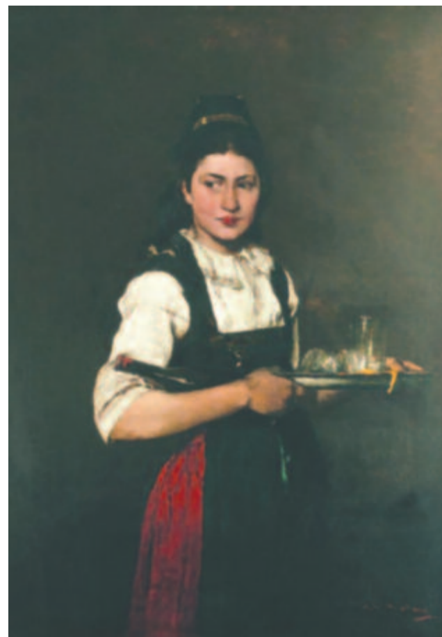
Munkácsy Mihály: Lány tálcával

Hogy tisztában legyünk a nagyságrenddel, érdemes egy izgalmas történelmi kitérőt tenni. 1956 tavaszán a kommunista vezetés legitimációs okokból mindenáron igyekezett hazacsábítani az Argentínába emigrált Páger Antalt. A fennmaradt jelentésekből kiolvasható, hogy az 1944-ben politikailag kissé „odakozmált” színészt a nyakára küldött ügynökök többek között egykori pályatársainak otthoni presztízsével és szokatlanul magas fizetésével próbálták jobb belátásra bírni. Döntő érvük pedig így szólt: „Latabár Kálmán havonta 56 ezer forintot keres.” Ez valóban szép summa volt: mai értékre átszámolva közel három és fél millió forint, amiből már bőven tellett jelentős festményekre is.