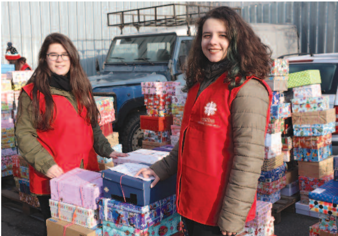
Önkéntesek a Caritasnál