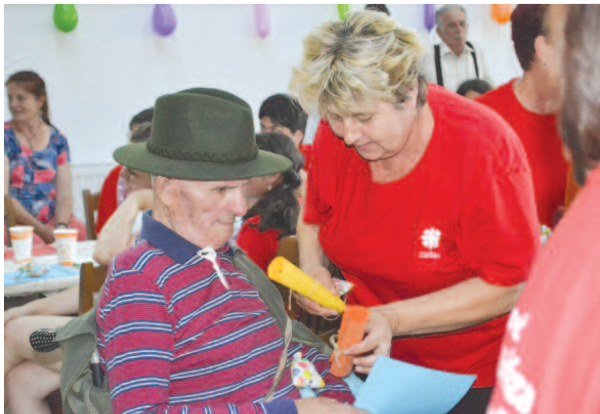
Gondviselés Háza idősök otthona, Búzásbesenyő