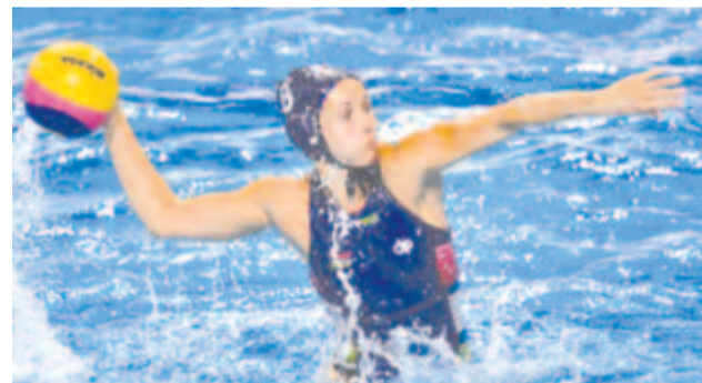
A magyar női vízilabda-válogatott Keszthelyi Rita vezérletével vívna ki az olimpiai indulás jogát Budapesten.

* Az Erste Liga tabelláján utolsó Vasas az utolsó harmadban kerekedett vendége, a Gyergyói HK fölé vasárnap, így megszerezte harmadik rendes játékidős győzelmét a jégkorong Erste Liga alapszakaszában. Eredmények: Schiller-Vasas HC – Gyergyói HK (román) 3-1 (0-0, 0-0, 3-1), Brassói Corona – Sport Club Csíkszereda 5-2 (0-1, 4-1, 1-0), Hokiklub Budapest – UTE 7-2 (1-1, 4-0, 2-1). A tabella: 1. Sport Club Csíkszereda 83 pont, 2. FTC-Telekom 65, 3. Brassói Corona 65, 4. DEAC 58, 5. Dunaújvárosi Acélbikák 54, 6. Gyergyói HK 41, 7. UTE 41, 8. Fehérvári Titánok 31, 9. Hokiklub Budapest 29, 10. Schiller-Vasas HC 13.