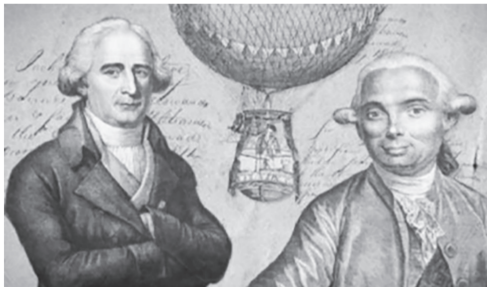
A Montgolfier fivérek

A testvérpár először a Cavendish által akkor felfedezett, a levegőnél könnyebb hidrogénnel próbálkozott. Mivel azonban az új gáz nagyon gyúlékonynak bizonyult, és még papírgyárak termékei között sem találtak olyat, amely megbízhatóan tárolta volna, a meleg levegő felé fordultak. Először papírszakókat tartottak a tűz fölé, és az egész a mennyezetig szállt fel. Később vékony textíliából, majd taftból készítették a zsákokat, amelyeket szalma és gyapjú égetésekor keletkező füsttel töltöttek meg. Mivel már hallottak Benjamin Franklin kísérleteiről, úgy