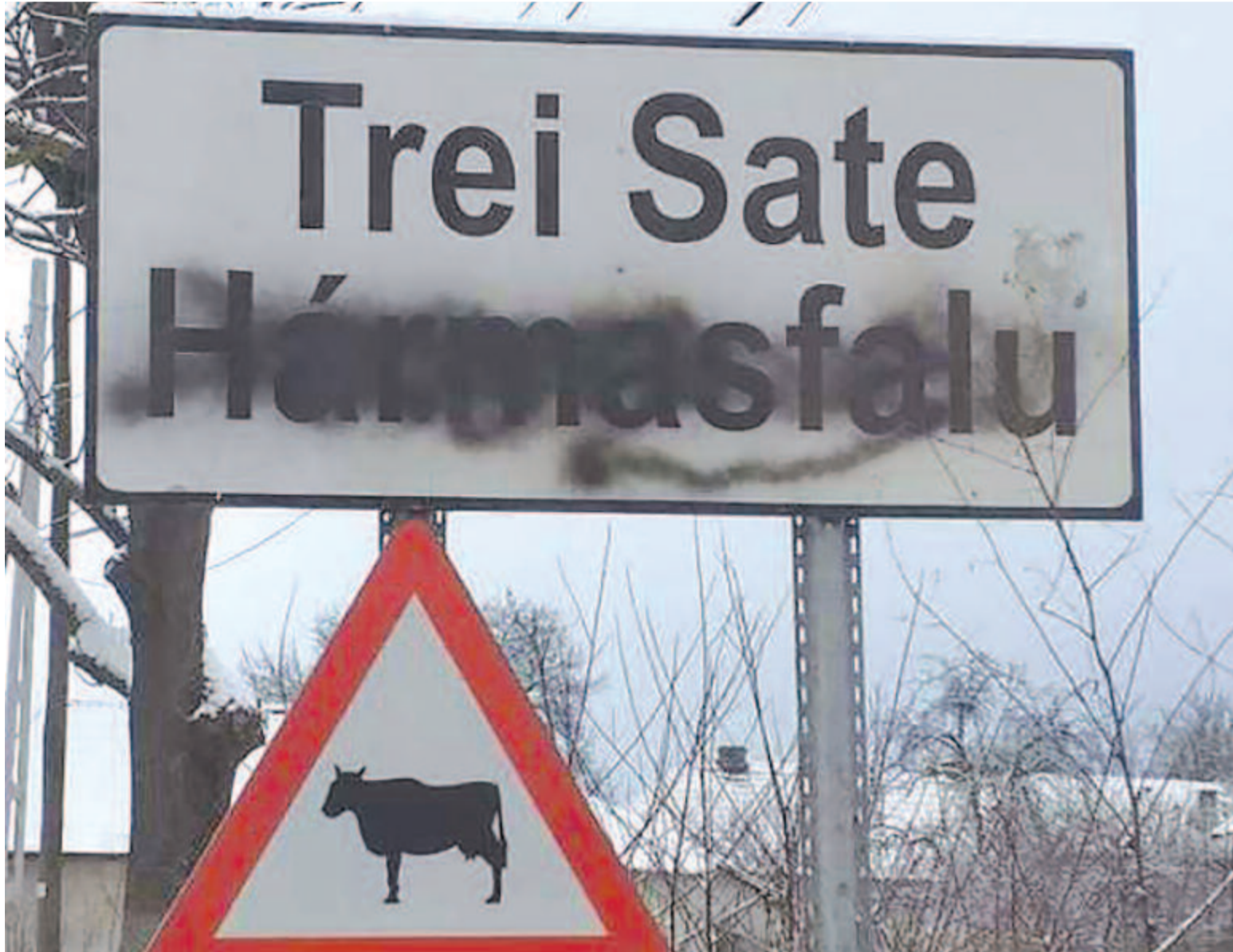
Többek között a hármásfalui tábla is kárát látta a felelőtlen elkövető tettének