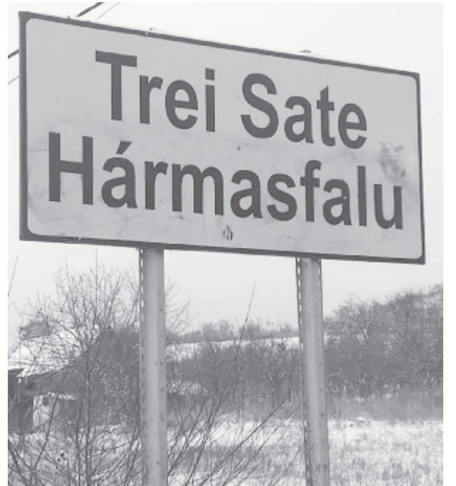
Hétfőn délre már a festék eltűnt a tábláról

A megyei MPP elnöke szerint nem szabad az esetet a román és magyar nemzet közötti ellentét jeleként beállítani, hiszen a Maros megyei románság elfogadta a magyar helységnevek kihelyezését, ami egy jogállamban elvárható. Ugyanakkor bebizonyosodott, hogy az elkövetők nem is megyénkbeliek voltak, ezért mindenkit nyuga-