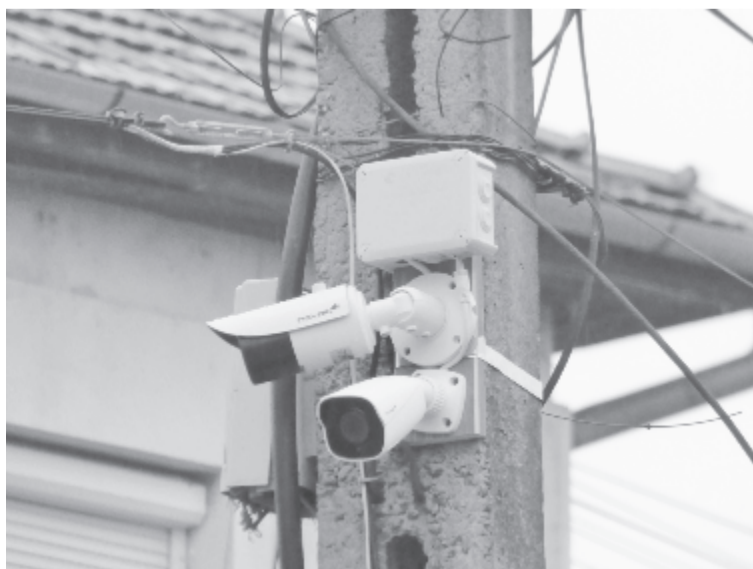
A község köztereit, utcáit, közintézményeit 59 kamera figyeli

A kamerarendszer kiépítése és beüzemlése már ebben a hónapban lezárul, azonban néhány berendezés felvételeit már követni lehet a község házában. A rögzített képanyagot tárolják, az bármikor visszanezhető, de felvételek csak rendőrségi nyomozás esetén adhatók ki. (grl)