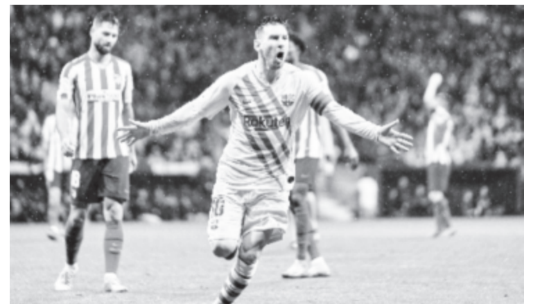
Főszerepben Lionel Messi az Atlético Madrid – Barcelona mérkőzésen: a katalánok argentin sztárja góljával eldöntötte a mérkőzést.

* Francia Ligue 1 , 15. forduló: Nantes – Toulouse 2-1, Montpellier HSC – Amiens SC 4-2, Nice – Angers 3-1, Nimes – Metz 1-1, Olympique Marseille – Brest 2-1, Lille – Dijon 1-0, Strasbourg – Lyon 1-2, Reims – Bordeaux 1-1, Stade Rennes – St. Etienne 2-1; 16. forduló: Bordeaux – Nimes 6-0, Lyon – Lille 0-1, Angers – Olympique Marseille 0-2, Brest – Strasbourg 5-0. Az élcsoport: 1. Paris St. Germain 33 pont, 2. Olympique Marseille 31, 3. Bordeaux 26.