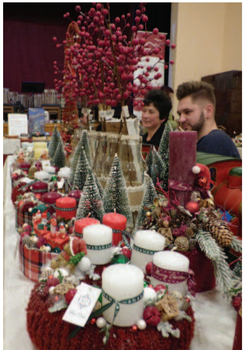
Idén is színes volt a kínálat

csolódnak, akár az egyház, akár az önkormányzat szervezi, és segítő kezét nyújtanak – részletezte az elnök.