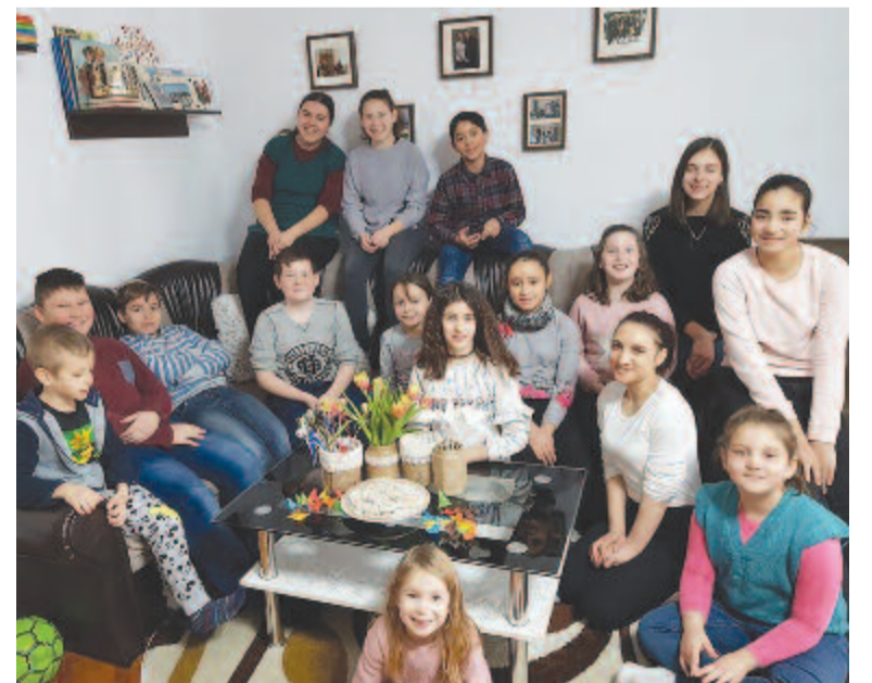
Vasárnapi iskolások egy csoportja