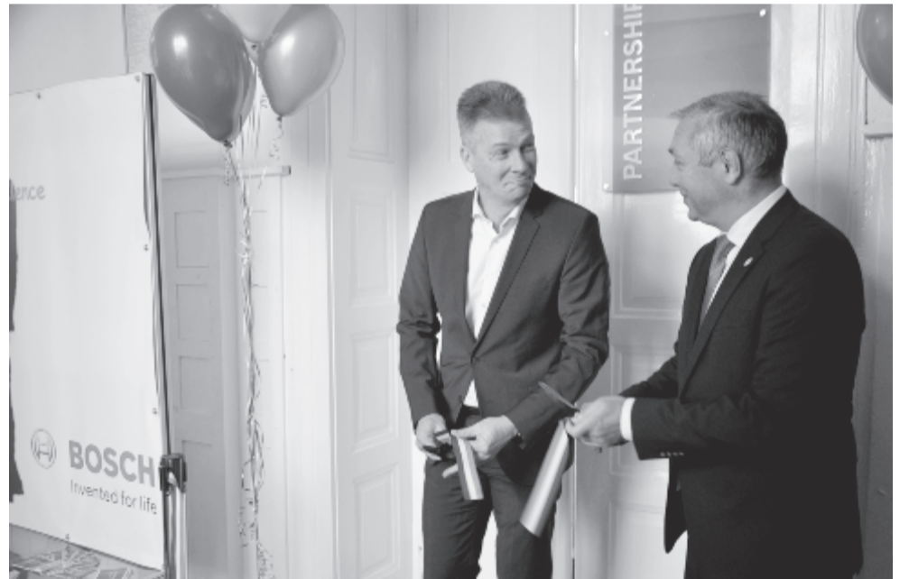
Szalagátvágás a Bosch-terem bejáratánál