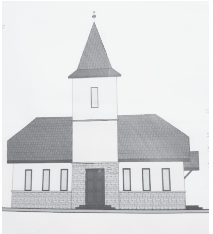
A következő évben elkezdik egy új, kisebb, de időtálló templom építését

A tervek elkészültek, az engedélyeket beszerezték, de az egyházkerület nagy templomjavítási programjába a templomépítés nem fért bele. Idén februárban a lelkész pályázatot nyújtott be a vallásügyi államtitkársághoz (a támogatásért köszönettel tartoznak Császár Károly szenátorának és Borbély László volt miniszternek), ahonnan pozitív választ és 100 ezer lej támogatást kaptak. Október első felében lebontották a régi templomot, a következő lépés a tereprendezés, alapásás, kiön-