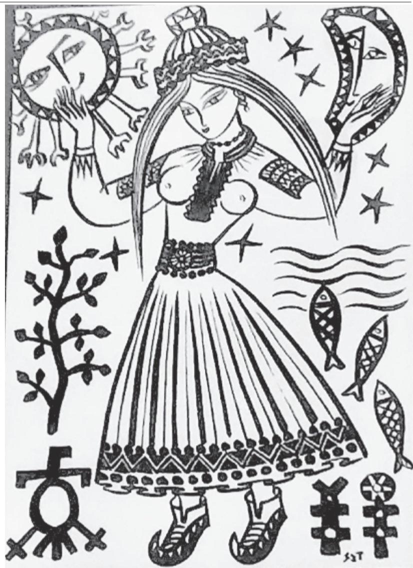
Szervátiusz Tibor rajza a Kalevala sorozatból

ó te istenáldott földrészt lenn vagy – a szemem rád fölnéz érett banán az újholdal íve akár a sarlónak nézem hosszan vágyakozva ha feljön a göncöl este szívemen a dél keresztje 1983