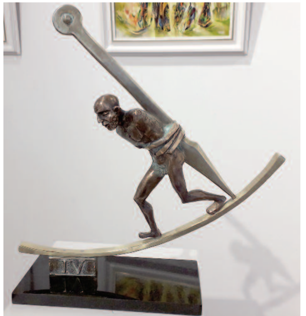
Az idő fogságában... Gyarmathy János szobra