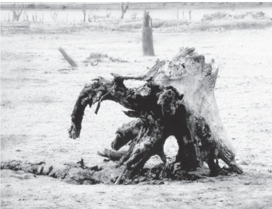
A bözödi szörny

Már nem siet, sétál az idő, Kinn hosszú szakállú eső. Nem gondolok már semmi jót, Hát beveszem az aliatót. S a bódító enyhülést várva, Belezuhanok az éjszakába. 2018