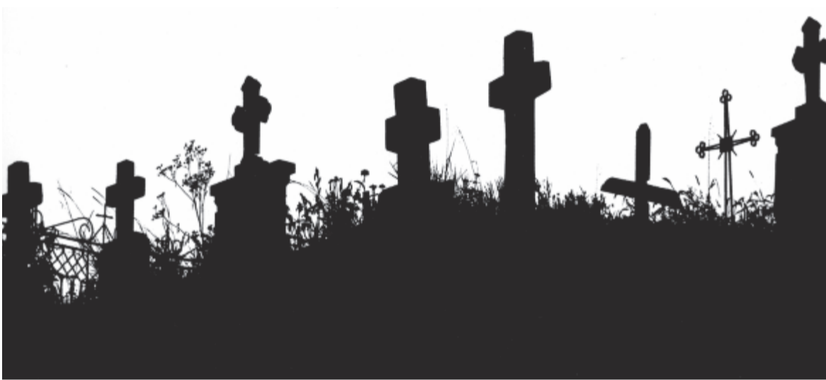
Kucsera Jenő: Keresztgrafika