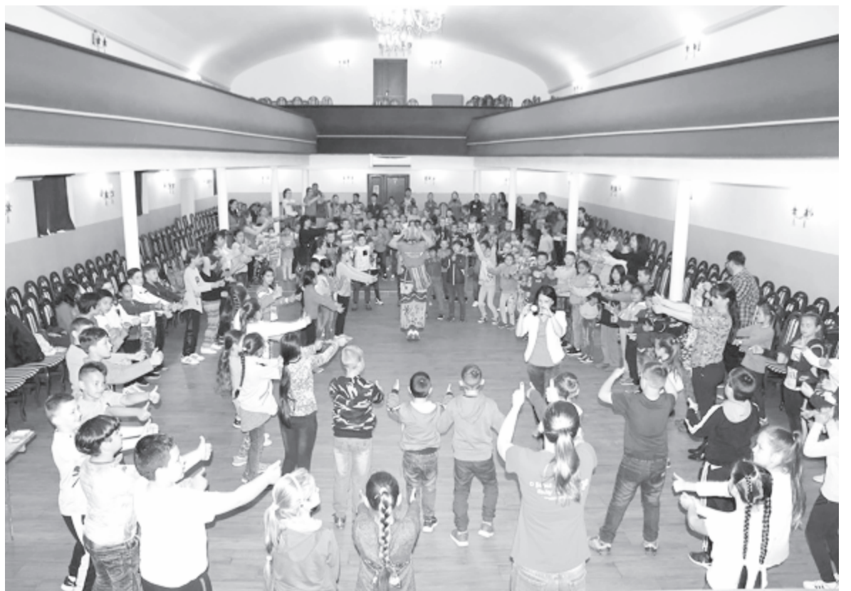
Erdőszentgyörgyön nagy volt a zsigongás csütörtökön a kultúrotthonban

bevonják őket, kirándulásokra, nyári táborokba vitték az erdőszentgyörgyi gyerekeket – mondta el lapunknak a helyi tevékenységek irányítója. (gligor)