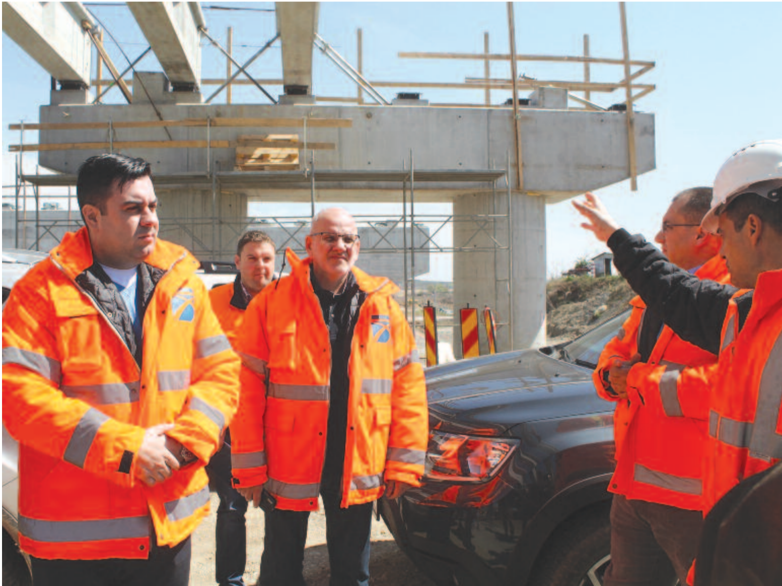
Alexandru Răzvan Cuc szállításügyi miniszter (baloldalt) az autópálya egyik munkatelepén