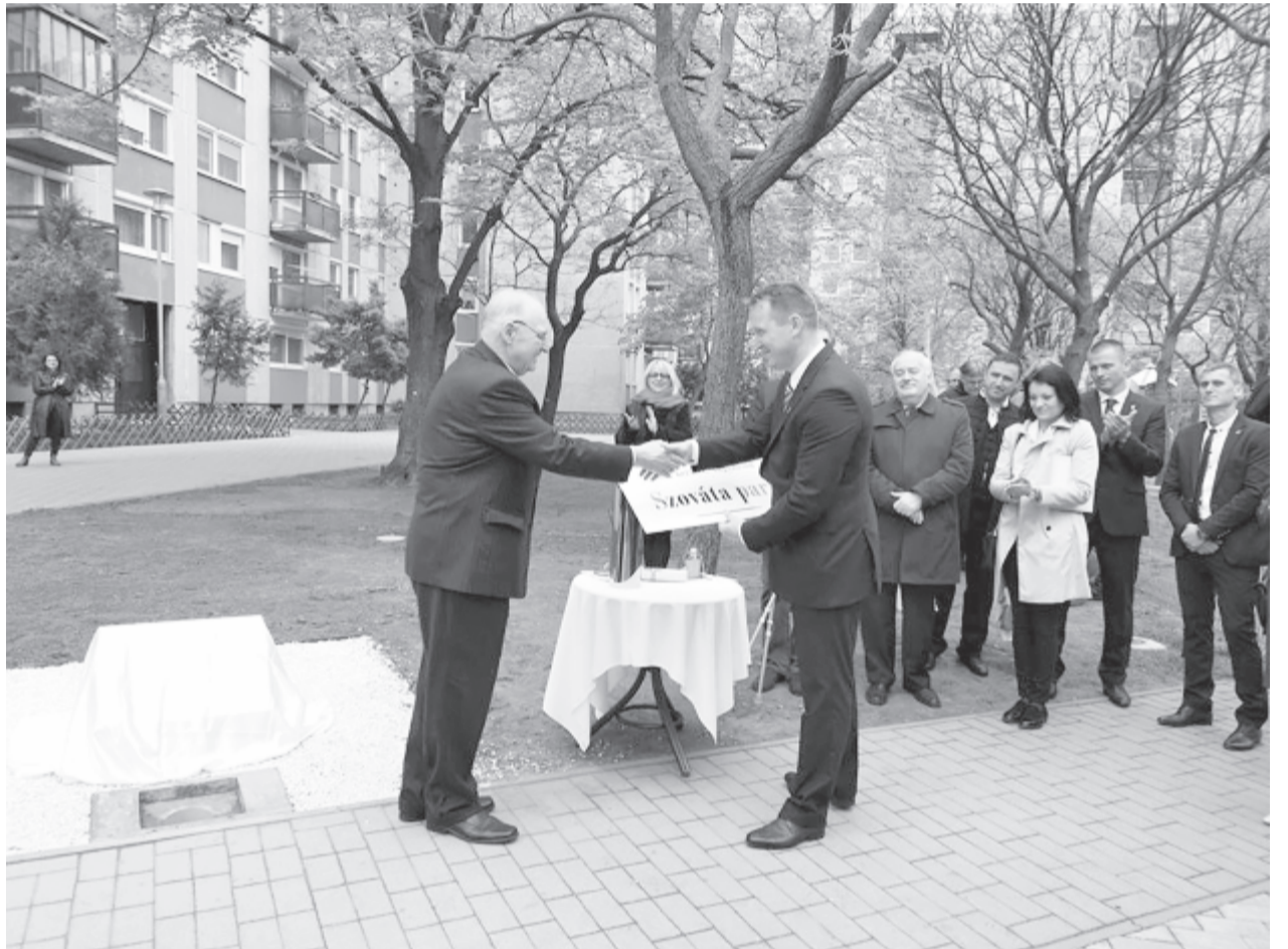
Ünnepélyes keretek között vette fel Szováta nevét egy angyalföldi park

Szovátát 1998-ban fogadta testvérvárosául a magyar főváros XIII. kerülete, a fürdőváros mellett a varsói Ochota, a bécsi Floridsdorf, a kassai Délváros és a délvidéki Eszék ápol még ilyen kapcsolatokat Angyalfölddel. (gligor)