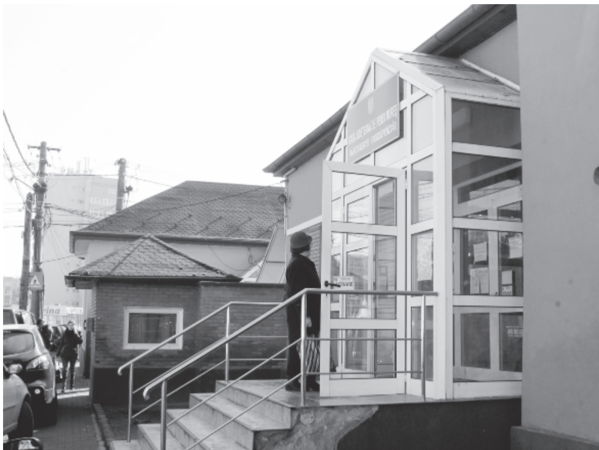
A Maros Megyei Nyugdíjpénztár

– Tizenkét típusú szociális juttatást folyósítunk hónapról hónapra. Elsőként a háborús veteránokat