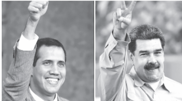
Juan Guaidó és Nicolás Maduro

A világ kormányai megosztottak Guaidó elismerésében: az Egyesült Államokkal az élen nagyjából ötven állam, köztük számos európai ország is elismerte az ellenzéki politikust ideiglenes venezuelai elnöknek, de más országok, köztük Oroszország, Kína és Törökország Madurót támogatják.