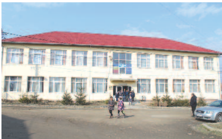
Felújított iskola Nagyteremiben

A meg nem valósított tervek között a lőrincfalvi iskola és óvoda pályázatát említették. Mint hangsúlyozták, az egyházi épületben működő iskola helyett újat szeretnének építeni. Ennek érdekében megvásároltak egy 42 áras telket, és a kiírásokra pályáznak. Legutóbb az épület tervezője késett három hónapot, és bár az utolsó között, de határidőre sikerült letenni a pályázatot, viszont az igénylés magas számaránya miatt nem sok esélyt látnak a finanszírozás elnyerésére. Ezt a tervet azonban mindenképp megvalósítják, mert sportteremmel és laboratóriumokkal felszerelt korszerű iskolát szeretnének. A tervek között szerepel a Lőrincfalvára és Teremiújfaluba tervezett napközi otthon építése – mivel erre egyre nagyobb igény mutatkozik a szülők részéről – ugyanakkor a községközponti óvoda felújítása, bővítése és felszerelése is.