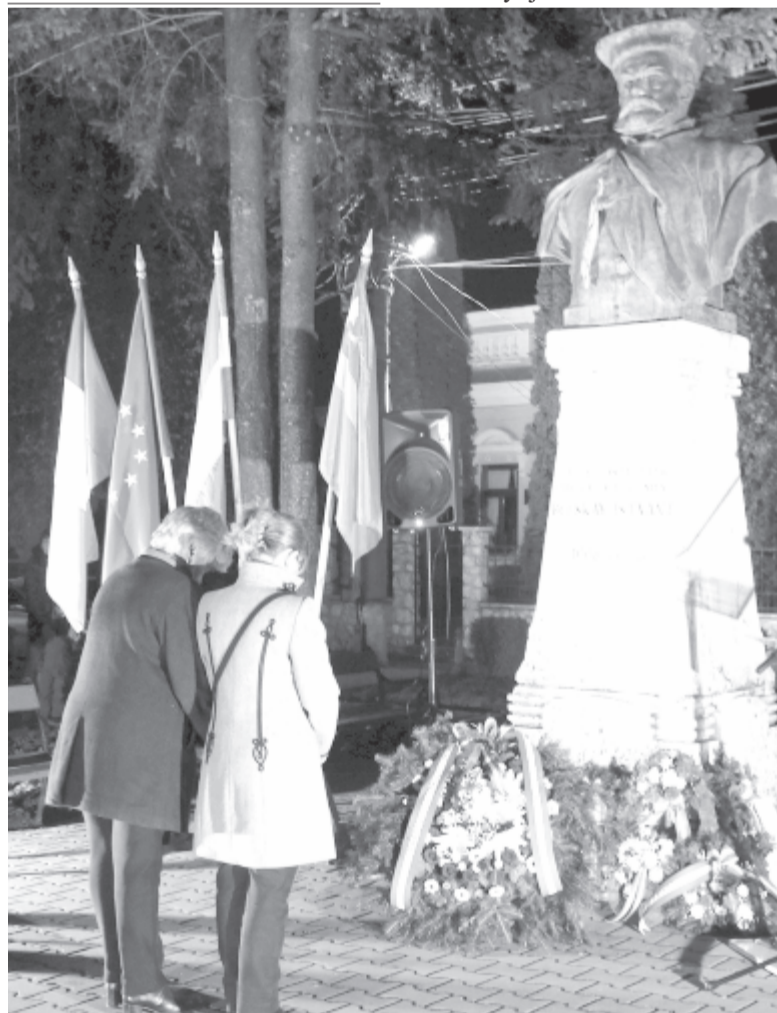
Csütörtökön este hajtottak fejet a fejedelem szobra előtt