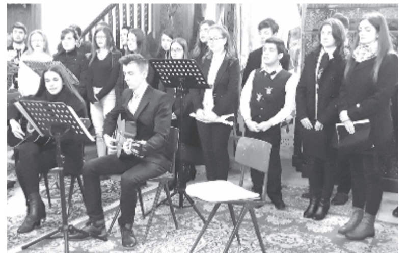
A középiskolások zenés irodalmi műsorral tisztelegtek a „magyarok Mózese” előtt