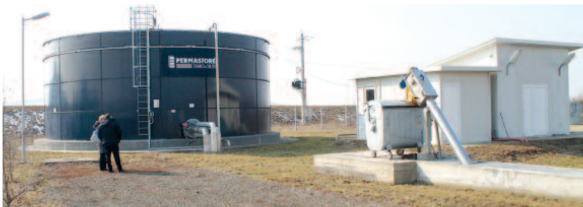
A szennyvíztisztító állomás

Felvetésünkre megtudtuk, hogy a vízhálózat kiépítése is sürgős volna, mivel nyáron vízhiánnyal küzd a lakosság, a kutak kiszáradnak. A község által megrendelt vízellátási tanulmány szerint a vízhálózat 8.284.653 lejbe kerül. A tanulmányt átadták a Maros megyei Aqua Invest beruházónak, mivel a Nyáradmentén is menedzseli a vízhálózat kiépítését, a nyáradmenti községek az uniós pályázattal megépített fővezetékre csatlakoznak majd.