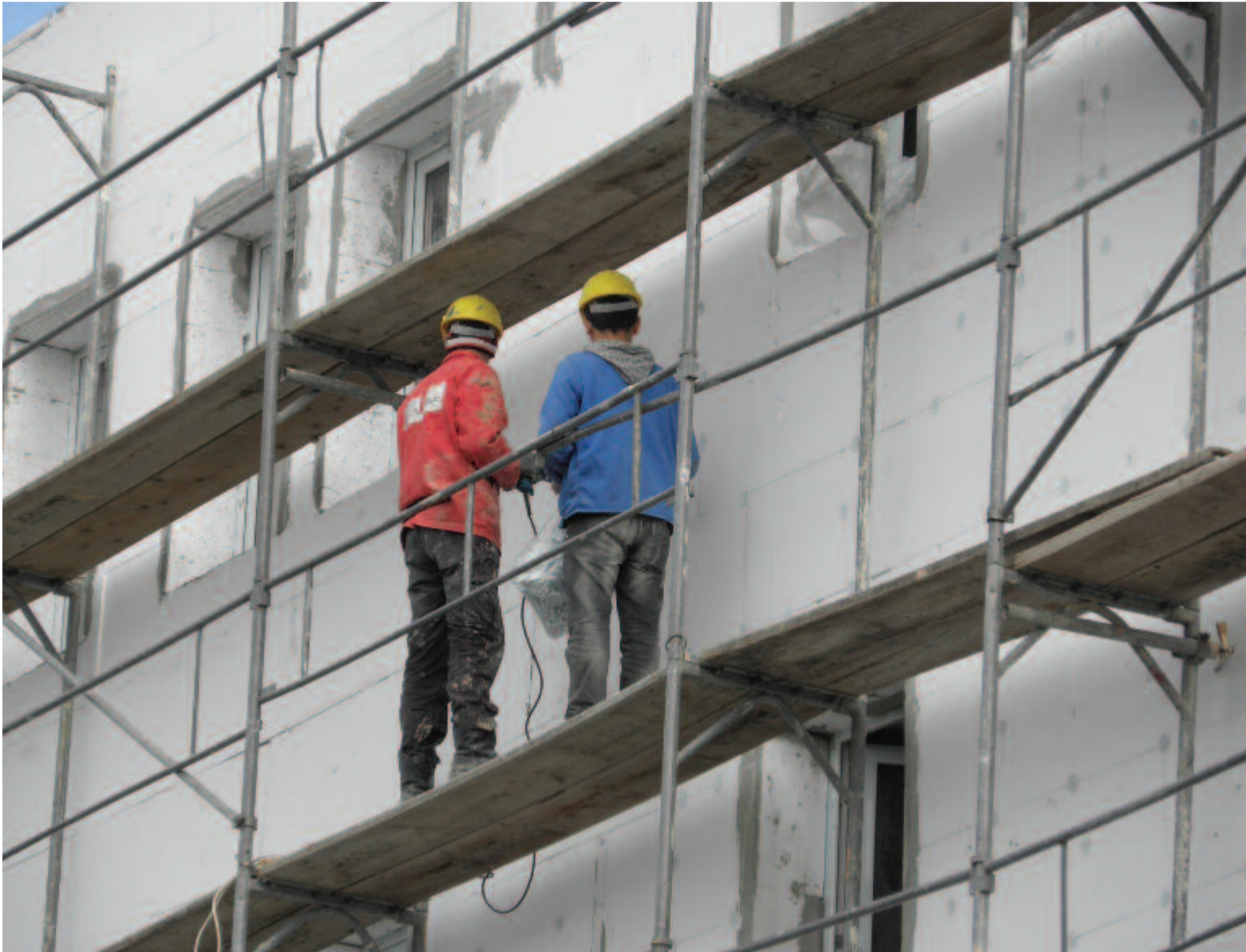
A jól kivitelezett hőszigetelés csökkentheti a fűtési költségeket